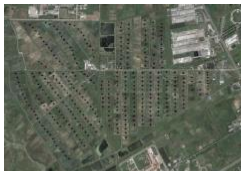
شکل 1- تصویر ماهواره‌ای از منطقه مورد مطالعه و محل نمونه‌برداری‌ها در مقیاس اول (200×50 متر) و مقیاس دوم (100×50 متر)

درصد کربن آلی آماده گردیدند. کربن آلی خاک با روش والکی - بلاک (پیچ 1982) و جرم مخصوص ظاهری با روش سیلندر از خاک دست نخورده اندازه‌گیری شد.