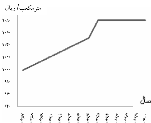
شکل 2- روند افزایش قیمت آب

شکل 2 که بر اساس معادله 8 ترسیم شده است، روند تغییرات قیمت را تحت روش مدیریت بر پایه هزینه استخراج نشان می‌دهد.