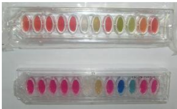
شکل 2- نمونه ای از کیت شناسایی باکتری Himedia بکاررفته در این آزمایش. تصویر بالایی پیش از مایه زنی و تصویر پائین پس از مایه زنی کشت باکتری می باشد.

1/922، 1/687 و 1/607 در این رتبه بندی قرار گرفتند. در این میان کمترین رشد و تجزیه در حضور گازوئیل برای باکتری‌های Stenotrophomonas maltophilia ، Paracoccus sp. و Sphingobacterium sp.، Ralstonia sp به دست آمد (جدول 4).