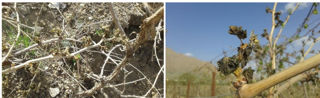
شکل ۲- خشک شدن جوانه شاخه‌ها در اثر سرمای دیررس بهاره در سال اول آزمایش (سال ۱۳۹۴).

مطابق نتایج شکل ۱ بیشترین مقدار طول شاخه در تیمارهای آبیاری I1، I2، I3، I4 و I5 از سال اول به ترتیب ۱۴۲، ۱۴۵، ۱۴۷، ۱۳۲ و ۱۳۵ سانتی‌متر در اندازه‌گیری چهارم (۱۵۰ روز از سال) است. در مقابل کمترین مقدار طول شاخه در تیمارهای آبیاری فوق به ترتیب ۱۱۰، ۱۲۰، ۱۰۸، ۱۰۵ و ۱۱۰ سانتی‌متر در اندازه‌گیری اول (۸۳ روز از سال) مشاهده شد. از طرفی در سال دوم آزمایش بیشترین مقدار طول شاخه در تیمارهای آبیاری I1، I2، I3، I4، I6 و I7 به ترتیب ۱۰۷، ۱۱۲، ۱۰۰، ۱۰۵ و ۱۴۴ سانتی‌متر در اندازه‌گیری چهارم و کمترین مقدار طول شاخه به ترتیب ۷۱، ۷۰، ۷۱، ۶۷ و ۶۷ سانتی‌متر در اندازه‌گیری اول (۸۳