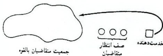
شکل ۱. سیستم صف (مدل تک سرویس

کوشش و تلاش ارلنگ ۲ در سال ۱۹۰۹ میلادی برای آنالیز تراکم خط تلفن با تقاضاهای نامشخص در سیستم تلفن کپنهاگن تحت عنوان تئوری جدید صف یا خط انتظار نتیجه داد. در حال حاضر این تئوری یک ابزار با ارزش در حرفه های مختلف بوده زیرا بسیاری از مسایل و مشکلات را می توان با تئوری صف شبیه سازی و مرتفع ساخت. به عنوان مثال در پروژه های عمرانی خصوصاً راه سازی در قسمت عملیات خاکی ۳ می توان به صورت مطلوب از تئوری مذکور استفاده نمود. سیستم صف با جمعیت متقاضی، چگونگی ورود ۴ و خدمت دهی ۵ ظرفیت سیستم و نظام صف مشخص می شود. یک سیستم ساده صف در شکل (۱) نشان داده شده است.