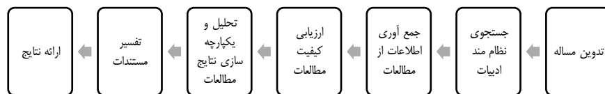
شکل (۱): مراحل مرور نظام‌مند (کوپر، ۲۰۱۵)

مرور نظام‌مند دارای سه بخش اصلی است (گوق ۲۵ و همکاران، ۲۰۱۷): تعیین و توصیف تحقیق‌های مرتبط (ترسیم نقشه تحقیق)، ارزیابی منتقدانه تحقیق‌ها به روشی نظام‌مند و گردآوری یافته‌های تحقیق‌ها (ترکیب). شکل ۱ فرایند انجام مرور نظام‌مند را نمایش میدهد. این فرایند هفت مرحله ای (کوپر، ۲۰۱۵) توسط بسیاری دیگر از پژوهشگران نیز به کار گرفته شده است.