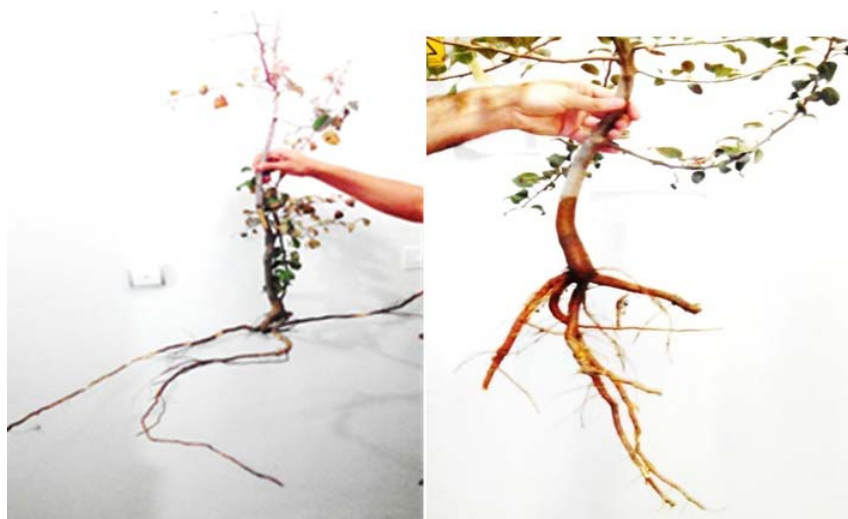
شکل ۱- مقایسه رشد ریشه در پایه پاکوتاه پیروودوارف (سمت چپ)

تجزیه واریانس داده‌ها نشان داد که اثر زمان بر جذب عناصر غذایی پرمصرف شامل نیتروژن، پتاسیم، فسفر، کلسیم و منیزیم و کم مصرف شامل آهن، روی، مس و منگنز باعث