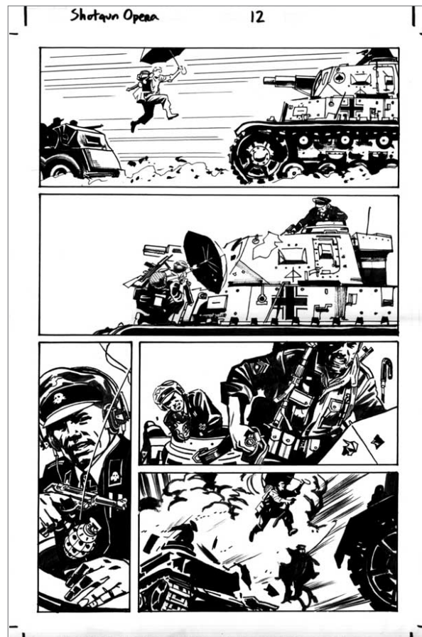
تصویر ۱- گروهان فیوری و کماندوهای خوفناکش در ژانر جنگی کمیک آمریکایی از مجموعه انتشارات مارول. مأخذ: (URL 4)

این در حالی است که در غرب نیز ژانرهایی چون ژانر وسترن، معادلی در ایران ندارد؛ چرا که این ژانر تا حد زیادی بر واقعیت تاریخی متکی است، از شروع قرن بیستم، استریپ‌های روزنامه‌ای، موضوعات و کاراکترهای وسترن را عرضه کردند که مبتنی بر وجود گروه‌هایی از گاوچران‌ها و افراد باغی و مهاجر و قبیله‌های سرخ‌پوست در غرب آمریکا بودند. این کمیک‌ها همچنین بر تصویری که آوازا، قصه‌های عامه‌پسند و نمایش‌های صحنه‌ای غرب وحشی از پیشگامان غرب نشان می‌دهند، متکی‌اند. اسمیت در مورد گونه‌های سینمایی این ژانر می‌نویسد: «بازیگران اولیه این فیلم‌ها گاهی این آمیزه واقع‌گرایی و اسطوره را بازتاب داده‌اند» (Smith & Duncan, 2009, 199).