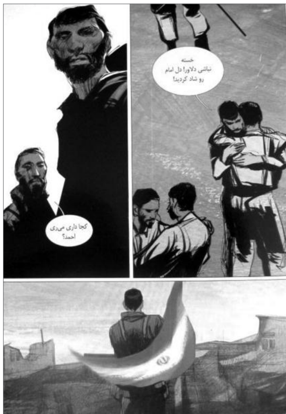
تصویر ۲- کتاب کمیک خط اول، داستان‌های دفاع مقدس در ژانر جنگی، از مجموعه حسن روح الامینی. مأخذ: (روح الامینی، برزا، مفوز، ۱۳۹۰، ۳۵)

از سوی دیگر ژانر علمی تخیلی نیز که ژانر گسترده‌ای است که در بسیاری از رسانه‌های پر مخاطب است، در ایران معادلی ندارد. این ژانر «همیشه درگیر تعمق درباره علم و تکنولوژی واقعی است. داستان‌های این ژانر خود را سرگرم درگیری بین ایده‌ها و اعتقادات انسانی و مفاهیم بیگانه‌ای کردند که در آنها موجودات اشرافی فضایی، زنان جوان را از چنگال غول‌های چشم قورباغه‌ای نجات می‌دادند» (ریچاردسون، ۱۳۷۳، ۴۴). با این تفاسیر، پیشینه هر دو ژانر نامبرده به جغرافیا، فرهنگ و دست‌آوردهای جهان غرب باز می‌گردد و کاملاً طبیعی است که نمودی در کمیک‌های ایرانی نداشته باشند. چنانچه متقابلاً ژانر مذهبی و عامیانه در ایران نیز همین ویژگی را دارد. ژانر مذهبی در ایران برآمده از عقاید و اهمیت امور دینی نزد ما است، که ممکن است ارزش‌های مذهبی چنین کیفیت حیاتی و تعیین‌کننده‌ای را در جهان غرب نداشته باشند. بنابراین عقاید مذهبی به روشنی در تصویرگری و داستان‌پردازی این ژانر قابل پی‌گیری است و بدیهی است که نمونه آن در کمیک‌های غربی یافت نمی‌شود. از سوی دیگر مناسبات موضوعی ژانر عامیانه بر یک فرهنگ بومی - مختص به یک محدوده جغرافیایی خاص - متکی است، بنابراین علت عدم وجود چنین ژانری در فرهنگ تصویرگری غرب بدیهی است. به نظر می‌رسد ژانرهای مشترک در کمیک ایرانی و غربی، عموماً ژانرهایی هستند که