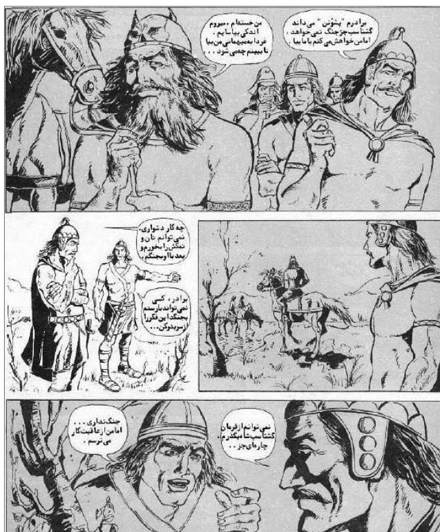
تصویر ۵- مجموعه کمیک رستم و اسفندیار با تصویرگری سیروس راد در ژانر حماسی. مأخذ: (ترهنده، ۱۳۹۰، ۶۹)