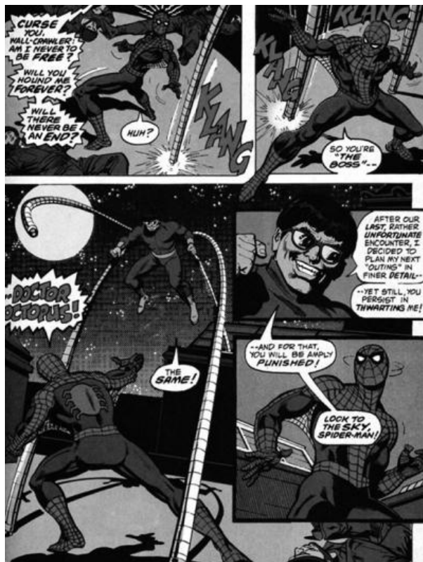
تصویر ۳- اسپایدرمن، استن لی، استیو دیتکو، در مجموعه اسپایدرمن و بتمن از انتشارات مارول در ژانر ابرقهرمانی.