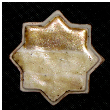
تصویر ۶- قسمت بالای تست شرایط احیاء ششم.