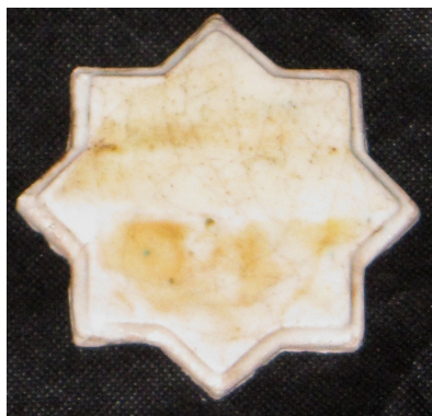
تصویر ۵- نمونه تست احیاء هشتم.