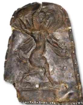
شکل ۲۱- پلاک نقره با نقش شیر، موزه ملی ایران.