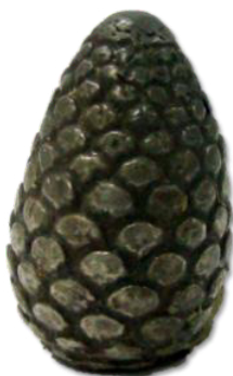
تصویر ۱۵- آب‌پاش نقره به شکل میوه کاج.

ظرف نقره به شکل پیکره بزکوهی (کل) (تصویر ۱۲)، به ارتفاع ۳۱ سانتی‌متر، با شاخ‌های پیچیده که پاهای عقبی و یک شاخ آن شکسته، دارای چشم‌های برآمده و ریش مخروطی که به صورت خطوطی ساده نشان داده شده است. شکل شاخ‌های پیچیده آن بیشتر شبیه به شاخ بزهای سکایی است. جام‌هایی که به شکل سر بز هستند، بیشتر در بین سکاها معمول بوده است (Barnet, 1968, 50). نقش بزکوهی و جانوران شاخدار حکایت از نیروی جاودانه‌ای دارد. احتمالاً میان شاخ‌های خمیده و هلال ماه در آغاز رابطه‌ای وجود داشته است. در دوران کهن ماه با باران و در مقابل آن خورشید با گرما و خشکی مرتبط بوده است. بنابراین شاخ‌های پیچ‌دار بزکوهی به عقیده مردم دوران باستان، در نزول باران مؤثر