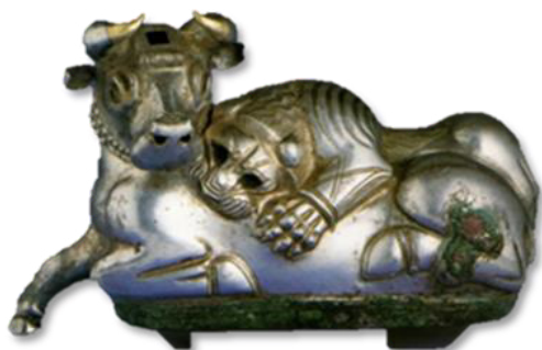
تصویر ۴- ظرف نقره به شکل پیکره نبرد شیر و گاو.

ظرف نقره به شکل پیکره عقاب با بال‌های گشوده (تصویر ۳)، در حالی که خرگوشی در دهان دارد، به ابعاد فاصله دو بال ۳۰/۵ و فاصله نوک تا انتهای دم ۲۲ سانتی‌متر که با تکنیک ریخته‌گری به صورت چند بخش جداگانه ساخته و به هم الصاق شدند و تزیینات روی آن به روش قلم‌زنی ایجاد شده است. در بالای سر عقاب، سوراخ مربع شکلی برای ریختن مایعات به درون ظرف تعبیه شده که از سوراخ‌های بینی خرگوش خارج می‌شده است. نام این پرند در متون کهن سومری و هیتی آمده است. نمونه‌های سفالین و فلزی آن نیز به شکل ریتون در آشور یافت شده است (Canby, 2002, 165-168). پاهای عقاب شکسته و چشم‌هایش مرصع بوده که سنگ آن افتاده است. استفاده از سنگ‌های رنگارنگ ابتکاری است که به روزگار جلال و عظمت شهر اور سومری باز می‌گردد (بهزادی، ۱۳۸۳، ۱۲۰). برای تزیین بسیاری از اشیاء کلماکره، از سنگ لاجورد و عاج استفاده شده است. لاجورد یکی از سنگ‌های وارداتی است که ساکنان غرب ایران مورد استفاده قرار می‌دادند که باید از منطقه بدخشان در شمال افغانستان آمده باشد (Simpson, 2000, 6). در پیکرنگاری آسیای غربی تا قرن هشتم ق.م شکل پرند ظاهر نشده است. در هنر لرستان نیز نقش پرند در هزاره اول ق.م نمایان می‌شود (Reade, 1978, 151). نقش عقاب در تپه گیان در هزاره چهارم ق.م روی خمره‌های سفالین دیده می‌شود. نقش عقابی که طعمه‌اش را در چنگال دارد، طرحی کاملاً شناخته