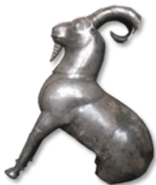
تصویر ۱۲- ظرف نقره به شکل پیکره بزکوهی، موزه فلک الافلاک.

ظرف مجوف نقره به شکل پیکره یک گاو کوهاندار ایستاده به ارتفاع ۱۵/۹ و عرض ۲۴/۱ سانتی‌متر که یک ورقه طلائی جلوی سر آن را تزیین کرده است (تصویر ۹). همچنین یک ستاره چند پر روی پشت گاو قرار دارد. یک حفره درب‌دار روی پشت گاو تعبیه شده که محل ریختن مایعات به درون ظرف، در مراسم آیینی بوده است. این ظرف با تکنیک ریخته‌گری به صورت دو قسمت جداگانه ساخته شده و به هم متصل شدند. گاو در هنر ایرانی پاینده و نگهدارنده بوده و از طرفی به ماه، حاصلخیزی و باروری هم مربوط می‌شده است. در تمدن‌های بین‌النهرین، هند و ایران نقش گاو را به گونه‌های متنوع گاو بالدار، گاو مرد و ... به کار بردند. ارزش‌های طبیعی و کاربردی این حیوان به خوبی شناخته شده بود و به همین دلیل آن چنان قدر و منزلتی می‌یابد که با اعتقادات و فرهنگ آنان در می‌آمیزد. احترام به گاو از معتقدات مذهبی اقوام آریایی بود که به وسیله اقوام مهاجر به آسیای صغیر و سپس به مصر منتقل شده است (رواسانی، ۱۳۷۰، ۲۳۸). پیکره گاو در