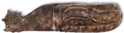
تصویر ۱۹- غلاف خنجر نقره، موزه ملی ایران.