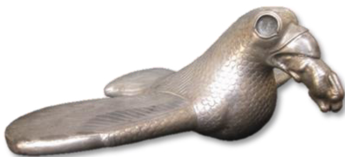
تصویر ۳- ظرف نقره به شکل پیکره عقاب و خرگوش، موزه فلک الافلاک.