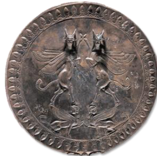
تصویر ۲۰- پلاک نقره با نقش گاومرد.