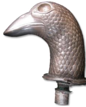
تصویر ۱۸- سر عصاره نقره‌ای به شکل مرغابی، موزه فلک الافلاک

که خود منبع الهی حیات است. نیلوفر به وسیله نفرتوم ۴ خدای مربوط به رع که در ممفیس مورد پرستش بود، تجسم یافت. در قرن هشتم ق.م نقش نیلوفر به فینیقیه و از آنجا به آشور و ایران انتقال یافت و در این سرزمین‌ها گاهی جانشین درخت مقدس می‌شود (هال، ۱۳۸۰، ۳۰۹ و ۳۱۰). گل لوتوس یا ترنج هندسی