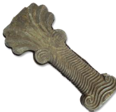
تصویر ۱۴- درخت نخل تزئینی از جنس نقره.