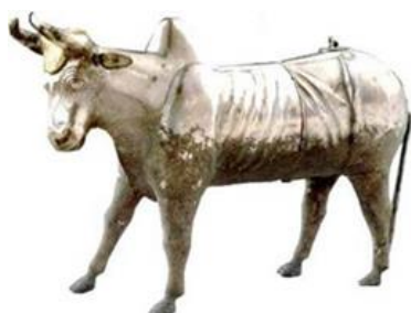
تصویر ۹ - ظرف نقره به شکل پیکره گاو.