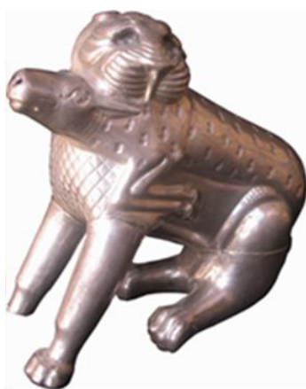
تصویر ۶- ظرف نقره به شکل پیکره شیر و غزال، موزه فلک الافلاک.

ظرف مجوف نقره به شکل پیکره شیر و غزال به طول ۱۸ و ارتفاع ۱۶ سانتی‌متر که شیر غزال شکار شده را به دهان گرفته و بر پشت خود حمل می‌کند (تصویر ۶). سر شیر کمی به طرف عقب برگشته و گردن شکار را در اختیار دارد. بخش‌های مختلف این نوع ظروف عموماً به طور جداگانه با تکنیک ریخته‌گری ساخته شده و به یکدیگر متصل شدند. نقش یال و دیگر اعضای حیوان به روش قلم‌زنی با خطوط مختلف هاشوری، نقطه‌ای و ... نشان داده شدند. نمونه مشابه این نقش روی یک ظرف لوله‌دار از مارلیک که شیری را در حالی که شکار خود را به دندان گرفته، می‌توان مشاهده کرد (Negahban, 1964, 16). یک سوراخ مدور روی سر شیر برای ریختن مایعات تعبیه شده و بینی غزال دارای دو سوراخ برای خروج مایع است. چشمان شیر مرصع بوده که سنگ آن افتاده است. لرستان و ایلام یکی از مراکز اصلی تزیینات جانورسان روی اشیاء فلزی بودند. این یکی از ویژگی‌های سبک فلزکاری غرب ایران است که در جاهای دیگر به ندرت دیده