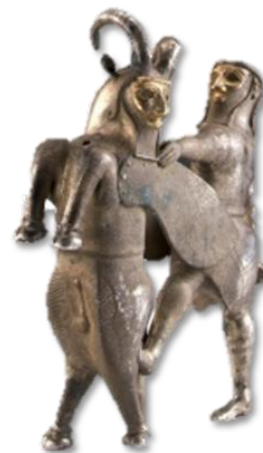
تصویر ۲- ظرف نقره به شکل بیکره یک قهرمان در حال مبارزه با گاومرد.

مرد قهرمان دارای یک ریش بلند چهارگوش از نوع آشوری و موهای بلند در پشت سر است. یک لباس مزین با آستین و دامن کوتاه شرابه‌دار به تن دارد. حاشیه دامن و لباس قهرمان دارای تزئینات مربعی از نوع آشوری است. دامن آن به صورت دو تکه بوده که لبه‌های آن روی هم قرار گرفته و با یک کمر بند تزئینی پهنی نگه داشته شده است. گاو بالدار (گاومرد) دارای