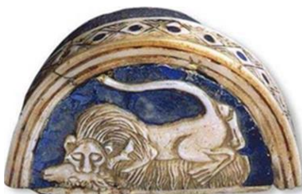
تصویر ۵- قدیم‌ترین نقش نبرد شیر و گاوروی یک جعبه‌لوازم آرایش از دوران سوم اور.

نبرد شیر و گاو به عنوان یک نمایش آسمانی از یک کشمکش نیروهای آسمانی بین صور فلکی برج ثور (گاو) و برج اسد (شیر)، پنجمین صورت فلکی منطقه البروج است. این نشانه فلکی شروع فعالیت کشاورزی در پایان فصل سرماست. شیر پیروزمند با قرار گرفتن در اوج و سمت الرأس، حداکثر قدرت خود را به نمایش می‌گذارد و به گاو که می‌کوشد از زیر افق بگریزد، حمله کرده و آن را می‌کشد و طی روزهای بعد در پرتو خورشید تا یک دوره ۴۰ روزه پنهان مانده، آن‌گاه دوباره زاده می‌شود و برای نخستین بار در اول فروردین طلوع می‌کند، تا اعتدال بهاری را اعلام کند. نبرد شیر و گاو در نیمه اول هزاره اول ق.م مناسب‌ترین و طبیعی‌ترین نماد برای دلالت بر اعتدال بهاری بوده است