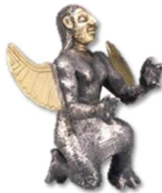
تصویر ۸ - مجسمه یک دیو ایزد از جنس نقره.

پیکرک نقره یک دیو بالدار با هیكل انسانی و دست و پاهایی به شکل پنجه عقاب به حالت نیم خیز، صورت و بال‌ها از جنس طلا، دارای بینی بزرگ، گونه‌های برجسته و ابروان به هم پیوسته، سینه‌های برجسته با موهای بلند بافته شده تا وسط کمر که یک پیراهن بلند تا قوزک پا به تن دارد. حاشیه دامن آن شرابه‌دار و کمر آن با یک کمر بند ساده بسته شده است (تصویر ۸). بالدار نمودن انسان از قرن ششم ق.م مرسوم بوده و در هنر ایران به منزله جریان هنری جدیدی به شمار می‌رفت (گیرشمن، ۱۳۴۶، ۷۳). وقتی