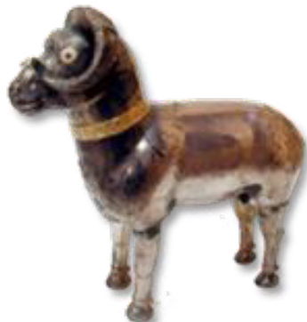
تصویر ۱۱- ظرف نقره به شکل پیکره قوچ.