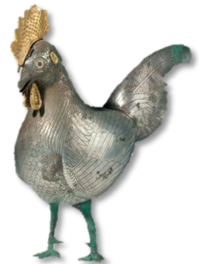
تصویر ۱۳- ظرف نقره به شکل پیکره خروس.