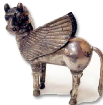
تصویر ۱۰- ظرف نقره به شکل پیکره گاو بالدار.