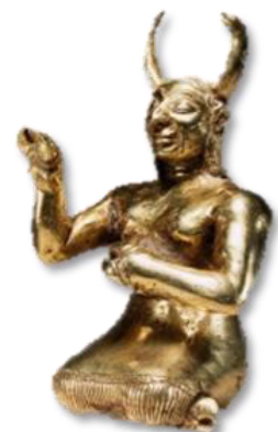
تصویر ۷ - مجسمه یک دیو ایزد از جنس طلا.

پیکرک طلائی یک دیو ایزد با هیكل انسانی و سم حیوانی که با تکنیک ریخته‌گری ساخته شده، دارای بینی بزرگ و بلند شبیه به لره‌های امروزی، گونه و سینه‌های برجسته و ابروان به هم پیوسته، دو شاخ در طرفین سر با موهای بلند موج و مجعد که در پشت سر به صورت حلقوی است (تصویر ۷). دیو یک پیراهن بلند تا قوزک پا بر تن دارد و حاشیه دامن آن شرابه‌دار است.