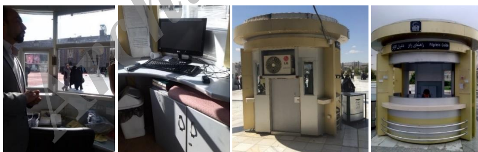
تصویر ۸. کیوسک راهنمای زائر داخل محوطه حرم امام رضا(ع)