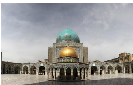
تصویر ۶. سقاخانه با نمای مسجدالاقصی، صحن قدس