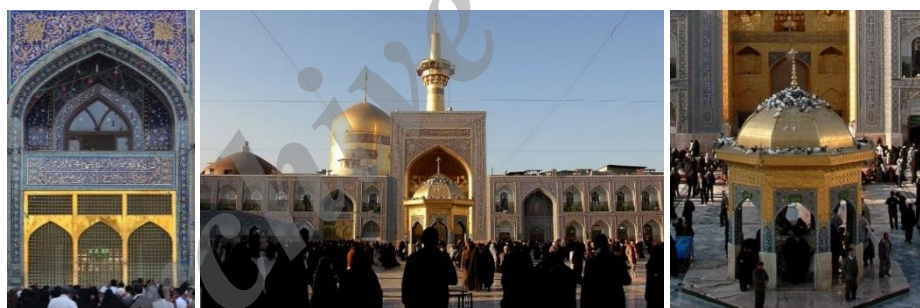
تصویر ۵. گنبد طلا، پنجره فولاد و ایوان طلا، سقاخانه نادری و صحن انقلاب