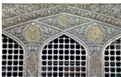
تصویر ۴. نمایی از ضریح مطهر امام رضا(ع)

حرم مطهر امام رضا(ع) نماد و نشانه‌ای برای شهر مشهد، ایران و نمادی برای اسلام و مذهب شیعه است. به دلیل ایجاد حس معنوی در افراد، بهره‌گیری از عناصر موجود در معماری ایرانی و اسلامی و به‌کارگیری رنگ‌ها و فرم‌های شناخته‌شده، این مکان در بردارنده هویت مکان مذهبی است. کل مجموعه براساس معماری اسلامی شکل گرفته است. صحن‌ها چهارایوانی است و کاشی‌های رنگارنگ با نقوش هندسی، گیاهی و خوش‌نویسی روی دیوارها و