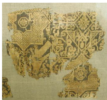
تصویر ۹. ابریشم سلجوقی قرن ۱۲ م