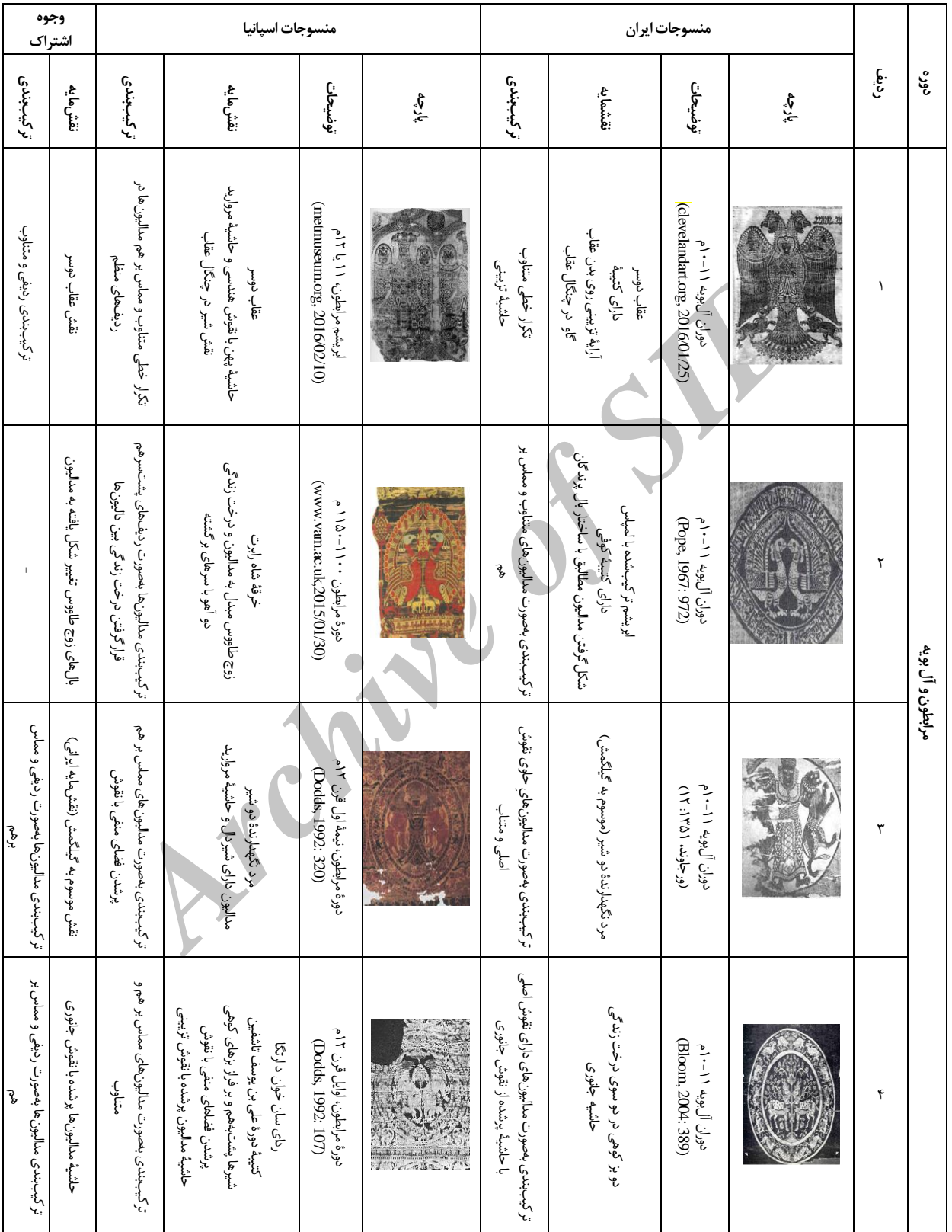
جدول ۱. مقایسه تطبیقی نقوش منسوجات ایران و اسپانیا