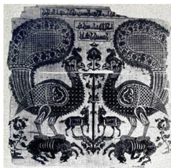
تصویر ۶. ابریشم طاووس‌های بزرگ، قرن ۱۱ میلادی