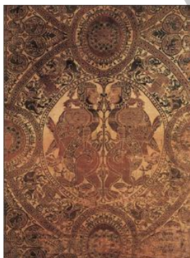
تصویر ۳. پارچه ابریشم، دوره مرابطون

استفاده از دوسری تاروپود برای ایجاد زمینه و طرح روی زمینه و تکنیک به‌هم‌پیوستن نخ‌های نازک چرم زرانودود برای تولید پارچه ابریشم نقش برجسته و لانه‌زنبوری، تنها به این گروه از ابریشم‌های اسپانیای اسلامی اختصاص دارد (Partearroyo, 1992: 106).