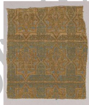
تصویر ۴. ابریشم زربفت قرن ۱۳ میلادی

در منسوجات موحدون، دایره‌های شامل جفت حیوان روبه‌روی هم، به تدریج ناپدید می‌شوند و دایره‌های با تزیین هندسی جایگزین آنها می‌شوند. طرح لوزی‌های مشبک، رزت، ستارهٔ هشت‌پر (تصویر) و... از تزیینات معماری وام گرفته شده و روی متن و حاشیهٔ منسوجات متداول