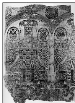
تصویر ۲. پارچه عقاب دوسر، دوره مرابطون

منسوجات مرابطون از نیمه اول قرن دوازدهم میلادی/ ششم هجری، ویژگی و تکنیک خاص خطوط ریز بافته‌شده بین دو رنگ کنار هم و خطوط برجسته را به نمایش می‌گذارد و این تأکید بر خطوط و نقش به‌جای توده‌ای از رنگ، با چنان دقت و درجه‌ای از کیفیت توسط بافندگان اسپانیایی اجرا شده که آن محصول ظریف و پیچیده، بیشتر از پارچه، به تابلوی نگارگری شبیه است. تشابه