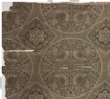
تصویر ۸. ابریشم سلجوقی قرن ۱۲ م