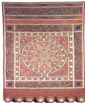
تصویر ۵. پرچم موحدون

می‌شوند. تزیینات کتیبه‌ها در این دوره با خط کوفی (تصویر ۵) یا خط شکسته پیوسته است که این کتیبه‌ها، با شناسایی توسط علم کتیبه‌خوانی ۳۱، یکی از منابع قابل اطمینان برای طبقه‌بندی منسوجات مزبور محسوب می‌شوند (Dodds, 1992: 110). در منسوجات این دوره، ساختار پارچه از چهار نخ تار تشکیل شده است که هر دو عدد از آنها برای زمینه و نقوش کاربرد دارد. رشته‌هایی از پود برای تزیینات فاقد برجستگی در پارچه وجود دارد و از پودهای ضخیم ابریشم بدون تاب، تنها برای بخش‌های برجسته‌شده توسط نخ‌های طلا کاربرد دارند (Partearroyo, 1992: 110).