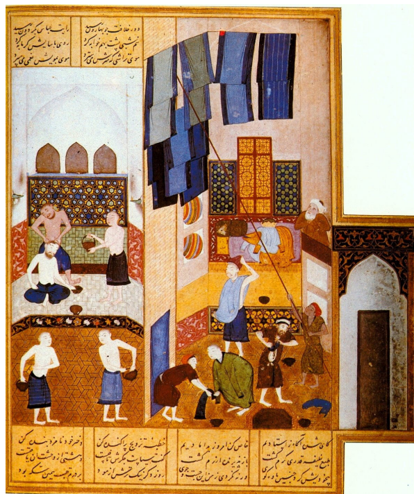
تصویر ۴- خلیفه هارون الرشید در حمام، خمسه نظامی، بهزاد، ۵۹۰۰ ق، کتابخانه بریتانیا.

اگرچه در این رابطه بیش متنی، هر دو تصویر پیش متن (تصویر ۴) و پیش متن (تصویر ۳) دارای یک وجه مشترک هستند و صحنه‌هایی از زندگی روزمره را می‌نمایانند، اما برخلاف این ویژگی مشترک، به دلیل تفاوت در عوامل فرامتنی مؤثر بر شکل‌گیری دو اثر همچون جامعه و تاریخ، پیشینه و بافت فرهنگی و هنری، گروه سنی مخاطبان و... تغییرات مضمونی، سبکی و ساختاری بیش متن نسبت به پیش متن بسیار قابل توجه است. چنانکه در این رابطه بیش متنی، انواع تراکونگی‌های فرهنگی، روایی، زمانی، محیطی، سنی، جنسیتی و... همچنین انواع تراکونگی به جهت تغییرات درونی مشاهده می‌گردد. در پیش متن (تصویر ۴)، صحنه‌ای از یک حمام با معماری و فضای سنتی و ایرانی - اسلامی تصویر شده که تمامی شخصیت‌های آن مردان بالغی هستند که در حال استحمام نمایانده شده‌اند. در این متن که اجزا و عناصر آن بیانگر انطباق اثر با ویژگی‌های ساختاری نقاشی ایرانی است، روح فرهنگ ایرانی - اسلامی حاکم است. در تصویر پیش متن (تصویر ۳) اما صحنه‌ای از یک مکان مسکونی با فضا و معماری غربی و امروزی تصویر شده که شخصیت‌های نمایانده شده در آن، ترکیبی از زنان و مردان در سنین مختلف را شامل می‌شوند. تمامی شخصیت‌ها، پوشش‌ها، عناصر و لوازمی که در این متن تصویر شده‌اند، تابعی از فرهنگ غربی و معاصر پیش متن هستند.