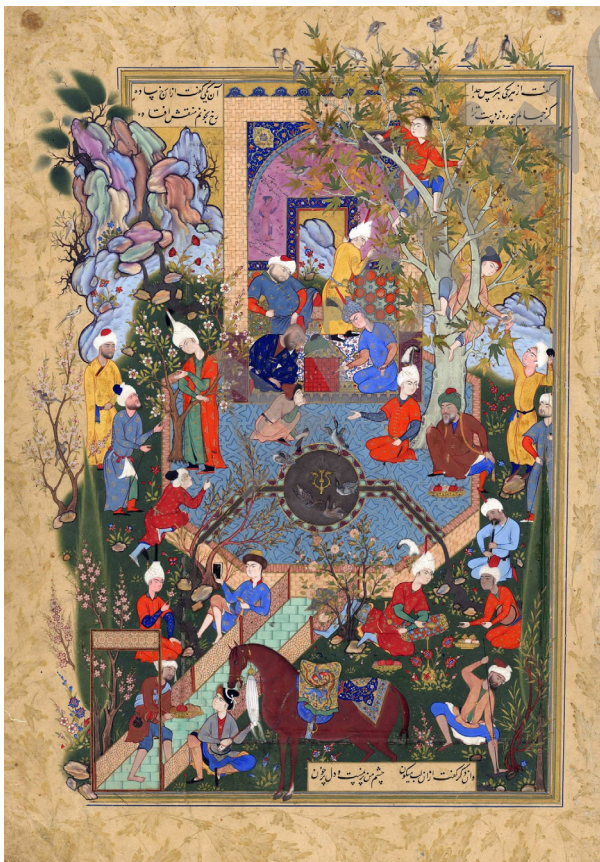
تصویر ۹- پند پدر درباره عشق، هفت اورنگ جامی، منسوب به میرزاعلی، قزوین یا مشهد، ۹۷۳-۹۶۴ ه. ق، نگاری فریر واشینگتن. ماخذ: (کورکیان و سیکر، ۱۳۷۷، ۱۱۸)

برخلاف سایر پیش‌متن‌های مورد مطالعه این نوشتار، مضمون این بیش‌متن (تصویر ۸)، صحنه‌ای واقع‌گرایانه و طبیعت‌پردازانه از زندگی روزمره غربی نبوده، بلکه تصویری تخیلی و غیرواقع است که با موجوداتی عجیب و غیرطبیعی نمودی بیشتر یافته است. همچنین به هریک از شخصیت‌های بیش‌متن (تصویر ۸) در قالب پوشش و لوازم همراه آنها عناصری افزوده شده که نمادی از فرهنگ‌ها، تمدن‌ها و ملیت‌های مختلفی است که دنیای