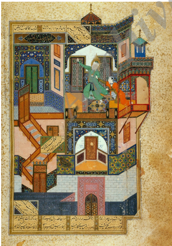
تصویر ۲- فرار یوسف از اغوای زلیخا، بوستان سعدی، بهزاد، ۵۸۹۳ ق. کتابخانه ملی قاهره.

سطوح رنگی تخت نیز از نکات قابل توجه است (همان، ۶۰۱-۵۹۹). چنانکه گفته شد دو پیش‌متن نخستی که پالما روسی برای بیش‌متن‌های خود برگزیده، دو نگاره "فرار یوسف از اغوای زلیخا" (تصویر ۲) و "خلیفه هارون الرشید در حمام" (تصویر ۴)، از آثار کمال‌الدین بهزاد در قرن نهم هجری هستند. نگاره "فرار یوسف از اغوای زلیخا" از نگاره‌های نسخه خطی بوستان سعدی، مهم‌ترین و مطمئن‌ترین اثر بهزاد به جهت انتساب به وی است که در ۵۸۹۳ ق. تصویر شده و در کتابخانه ملی مصر در قاهره نگهداری می‌شود. این نقاشی، به دلیل آنکه واجد بیشترین ویژگی‌های نقاشی ایرانی است، یکی از شاخص‌ترین نگاره‌های ایرانی به شمار می‌آید که تاکنون نیز بسیاری از پژوهشگران در پژوهش‌ها و نوشتارهای خود بدان پرداخته‌اند، اما پالما روسی، آن را مبنا و پیش‌متن تصویری اثر خود قرار داده است. مشاهده و قیاس دو تصویر در این رابطه بیش‌متنی بیان می‌دارد که رابطه برگرفتنی و اشتقاق میان آنها، با تغییر و دگرگونی همراه بوده، بدین معنا که پیش‌متن (تصویر ۲) در فرآیند تبدیل به بیش‌متن (تصویر ۱)، دچار تحول و دگرگونی شده، از این‌رو این رابطه بیش‌متنی از نوع تراگونی است. از سوی دیگر بیش‌متن به دلیل آنکه تنها برگرفته از یک پیش‌متن یعنی نگاره "فرار یوسف از اغوای زلیخا" است، دارای پیش‌متنی انحصاری است. نگاره پیش‌متن، اگرچه برای باب نهم از بوستان سعدی تصویر شده که به توبه و راه صواب اختصاص یافته، اما موضوع شعر آن، داستان یوسف و زلیخا، داستانی قرآنی است که در قرآن از آن به