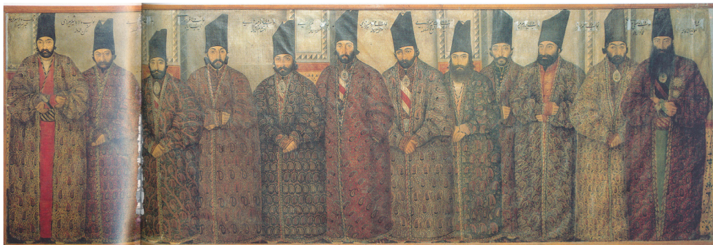
تصویر ۶- دیوارنگاره صف سلام ناصرالدین شاه اثر صنیع الملک، کاخ نظامیه (لقانطه).

الف: آثاری که رونگاری هایی با کیفیت ها و اندازه های متفاوت از اثر عبدالله خان در کاخ نگارستان بودند با همان افراد و صحنه (تصویر ۸)؛ ب: گروه دیگری به لحاظ ساختار ترکیب و مضمون کلی به پیروی از صف سلام آغازین خلق شده بود ولی افرادی که در صف حضور داشتند، شخصیت ها و شاهزاده های دیگری بودند. برای مثال در دیوارنگاره عمارت دیوانی قم، افراد به تصویر درآمده فقط شاهزادگان هستند و کسی از سفرا یا شخصیت های کشوری و یا هنرمندان حضور