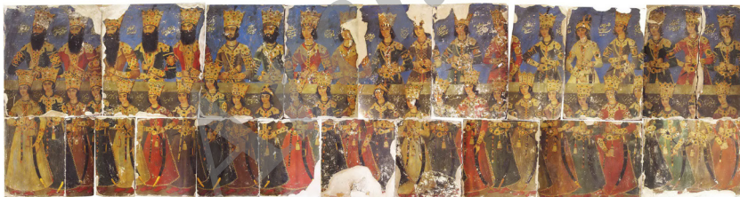
تصویر ۴- دیوار نگاره صف سلام، هنرمند ناشناس، عمارت دیوانی قم.