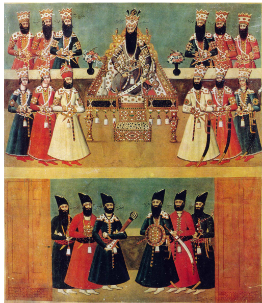
تصویر ۸- صف سلام، رنگ روغنی بر روی بوم، اثر محمد علی، موزه ارمنیاز، سن پترزبورگ. ماخذ: (Meslensityna, 1975, 126)

در اینجا است که می‌بایست انتخاب ظریف فتحعلی شاه را ستود زیرا هیچ کدام از هنرمندان کار کشته دربار، «معمار» نبودند. آنان فقط در امر تصویر خبیر بودند و بصیر. تنها هنرمند آن دوران - و البته همه دوران‌های تاریخ هنر ایران - که هم‌زمان معمار باشی و نقاش باشی بود، عبدالله خان بود. تفاوت وی با دیگران در آن است که طبعاً فهم عمیق‌تری از ارزش‌های بصری در فضاهای سه بعدی بنا دارد. روابط متقابل سطوح و رنگ‌ها را درک می‌کند، شناخت دقیق‌تری از روابط مواد و مصالح در معماری و نقاشی دارد و می‌تواند سنجش درستی از مقیاس تصویر و نسبت آن با میدان