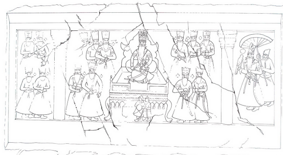
تصویر ۵- نقش خاقان، اثر عبدالله خان، شهرری، اجرای خطی توسط نگارنده.

بررسی تاریخ نقاشی نشان می‌دهد، سرمشقی که عبدالله خان به سفارش فتحعلی‌شاه پرداخته بود، با مرگ هنرمند و حامی‌اش از رونق نیافتاد و شاهان بعدی قاجار نیز کمابیش کوشیدند شوکت و عظمت خود و بارگاه‌شان را با سفارش اثری مشابه، به هنرمندان درگاه‌شان جاودانه کنند و خود را در کسوت خاقان مغفور و جانشین بر حق او جلوه دهند. از همین روی صف سلام دیگری به