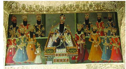
تصویر ۳- دیوارنگاره صف سلام، اثر عبدالله خان، کاخ سلیمانیه، کرج.

هنر نوظهور حجاری نیز راه یافت و بزرگ‌ترین و البته امروزه شناخته‌شده‌ترین حجاری فتحعلی‌شاهی یعنی «نقش خاقان» شهرری، به لحاظ مضمون و ترکیب بندی، در امتداد صف سلام کاخ نگارستان قرار دارد (تصویر ۵).