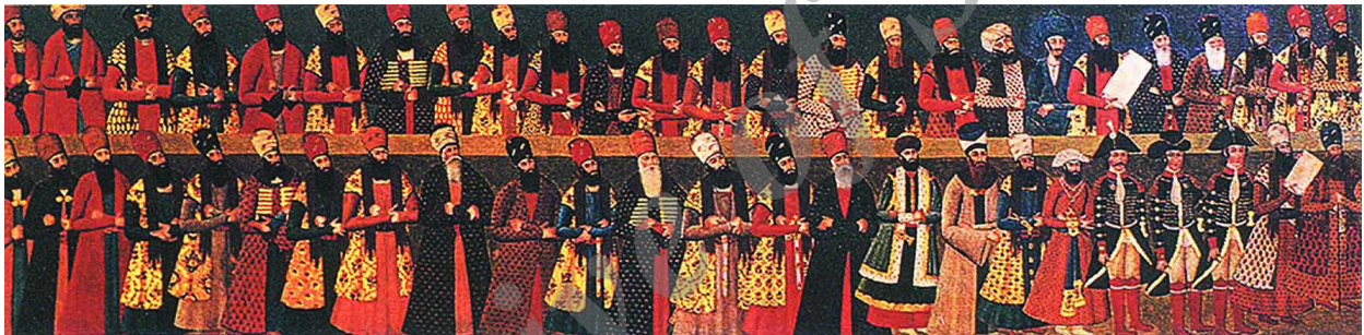
تصویر ۲- دیوارنگاره صف سلام، کپی از اثر عبدالله خان، هنرمند ناشناس (دیوار جانبی).