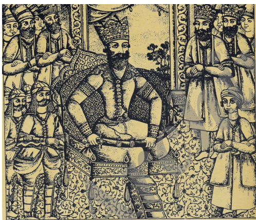
تصویر ۷- برگی از شاهنامه فردوسی، چاپ سنگی ۱۲۶۶ هـ، بر تخت نشستن کیکاووس، اثر علی اکبر.

چنین پیداست که انتقال به باغ نگارستان به فال نیک گرفته شده است. دور نیست که این فال نیک به واسطه خاتمه جنگ خونین چند ساله ای باشد که بالاخره اندی پیش هر طور بود با قراردادی در قریه گلستان به پایان رسید و نه تنها تهدید روس منحوس را از میان برداشت، بلکه سلطنت را در دودمان قاجاریه تائید و تثبیت کرد و ابرقدرت روس را مدافع حاکمیت قاجارها بر