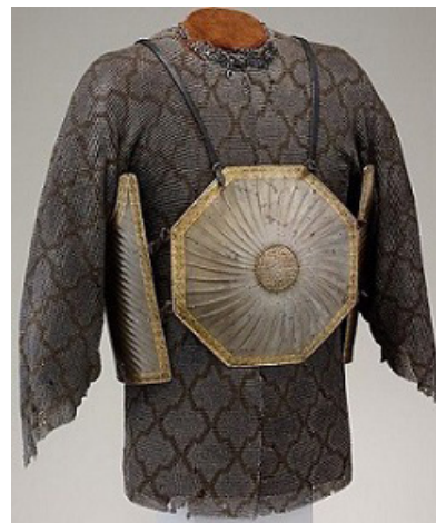
تصویر ۳- چهارآئینه موجود در موزه هنری متروپولیتن نیویورک، ایران یا هند. تاریخ: اوایل قرن ۱۷ میلادی.

آئینه به سبب درخشندگی و تالو خود، همیشه مورد توجه هنرمندان بوده است. آن را به صفای درون و پاکی نفس انسانی و صداقت مثال زده اند. یکی از غریب ترین و شگفت انگیزترین کاربردهایی که برای آئینه وجود داشته، کاربرد نظامی آن بوده است. بدین نحو که با تعبیه آئینه هایی در قطعات و اشکال منظم و بعضاً با قطعات شکسته بر روی لباس نظامیان یا بر روی برگستوان (زره اسبان یا چهارپایان جنگی)، سعی می کرده اند در دید دشمن اختلال ایجاد