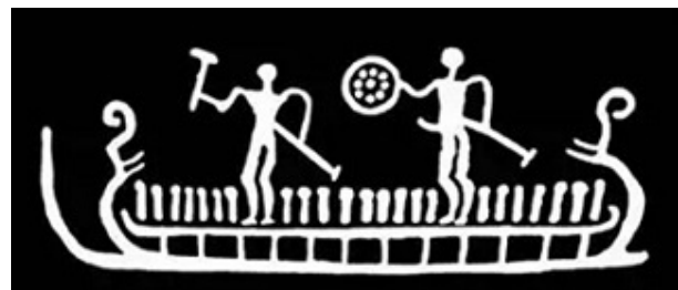
تصویر ۸- قایقرانی با سپری منقش به نماد خورشید در یک سنگ نگاره سوئدی از عصر حجر.