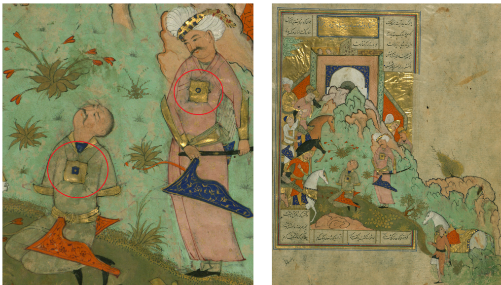
تصویر ۲- کشتن مهرک توسط اردشیر محل نگهداری موزه والترز شماره اثر W602.000924 و جزئیات سپر نصب شده.