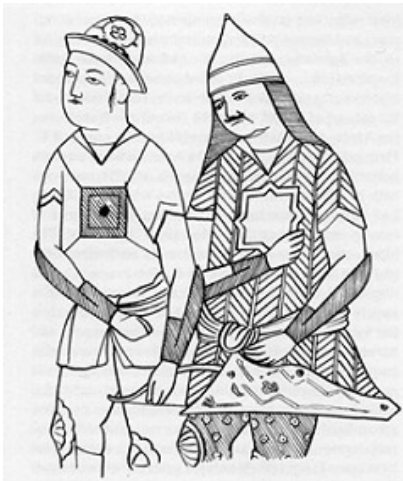
تصویر ۵ - آئینه‌های به‌کاررفته در البسه نظامیان شاهنامه ۷۶۰۲ موزه والترز.

هشت، عدد رمزی خورشید در سراسر اروپا، آسیا و آفریقا است (ژیران، ۱۳۷۵، ۱۳). در عهد باستان، هشت عدد سعد و