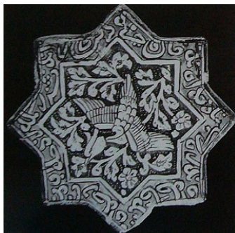
تصویر ۱۱- سفال زرین فام ایرانی مربوط به قرن ۱۴م/ ۸۰ ه.

چهارگانه (شرق، غرب، شمال و جنوب) تلقی شده و ستاره را نمادی از امتزاج عناصر و جهات جلوه می‌داده است. از سویی نیز می‌توان چنین پنداشت که ستاره موجود، از هم‌نشینی مطابق چهار عنصر اصلی زمینی و صور آسمانی و روحانی همین عناصر بر روی هم و چرخش جبری آن در گردونه زمان پدید آمده است. چیزی که ما را به مفهوم ستیز دائمی خیر و شر زرتشتی و مانوی و حتی نماد چینی بین و یانگ نزدیک می‌سازد. یک چارآیینه فروافتاده به زمین در