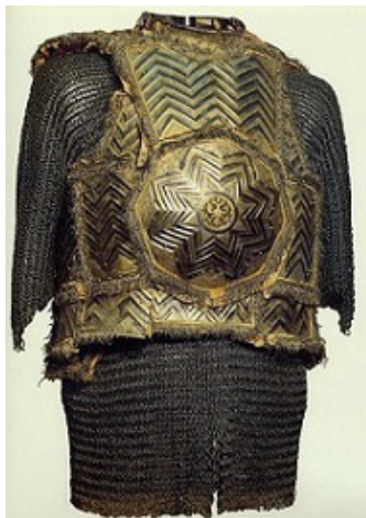
تصویر ۴- زره متعلق به تزار الکسی میخالوویچ موزه مسکو که از چهارآئینه های هشت پرو هشت گوش ایرانی- هندی مایه گرفته است.

چارآئینه آئینه آن ترک جفاجوست (رایج، به نقل از: آندراج) ۶ نوع ویژه ای از آئینه ها که در شاهنامه نسخه مورد نظر ما بسیار نمایان است، قطعات آئینه ای با اشکال منظم هشت ضلعی بوده اند که بر روی سینه نظامیان می چسبیده اند. این نوع، تفاوت اندکی با چارآئینه های دارای نماد ستاره داشت و مرکز برخی از اینها