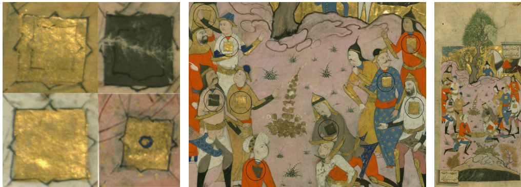
تصویر ۱- گردن زدن سیاوش محل نگهداری موزه والترز. شماره اثر W602.000280 و جزئیات سپر نصب شده.

مثلث، مربع و یا هر شکل دیگر هندسی، علاوه بر فرم ظاهری، واقعیتی در خود دارند که درک آنها به وسیله تأویل، انسان را به دنیای تشابهات و تمثیل و درنهایت به حقیقت سوق می‌دهد