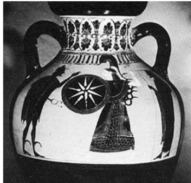
تصویر ۷- سرباز مقدونی در حال پیکار با سپری منقش به نقش خورشید.