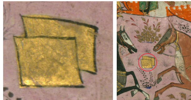
تصویر ۶- کشتن اسفندیار توسط رستم محل نگهداری موزه والترز شماره اثر W602-000809 و جزئیاتی از نقش ۲ مربع بر روی زمین.

چهارگانه (شرق، غرب، شمال و جنوب) تلقی شده و ستاره را نمادی از امتزاج عناصر و جهات جلوه می‌داده است. از سویی نیز می‌توان چنین پنداشت که ستاره موجود، از هم‌نشینی مطابق چهار عنصر اصلی زمینی و صور آسمانی و روحانی همین عناصر بر روی هم و چرخش جبری آن در گردونه زمان پدید آمده است. چیزی که ما را به مفهوم ستیز دائمی خیر و شر زرتشتی و مانوی و حتی نماد چینی بین و یانگ نزدیک می‌سازد. یک چارآیینه فروافتاده به زمین در