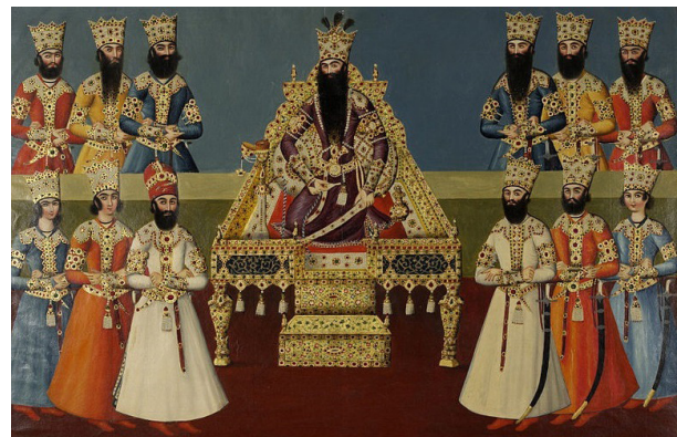
تصویر ۳- بارگاه فتحعلی‌شاه، منسوب به شاگردان عبدالله خان، آبرنگ مات، حدود ۱۲۳۱/۱۸۱۶ تا ۱۲۳۵/۱۸۲۰، کتابخانه بریتانیا، لندن.