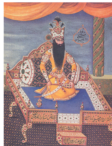
تصویر ۱- فتحعلی‌شاه بر تخت طاووس، آبرنگ‌مات، ۱۲۳۴/۱۸۱۸. از مجموعه صدرالدین آغاخان، تورنتو.