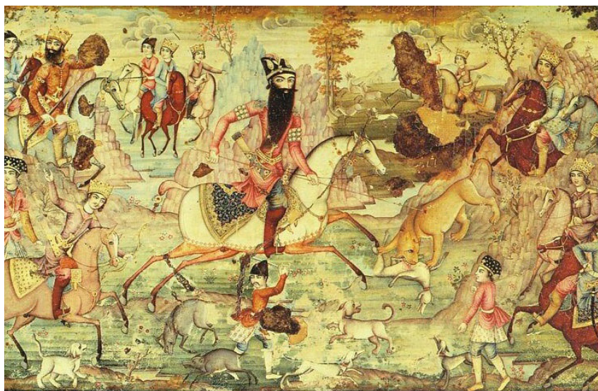
تصویر ۲- فتحعلی‌شاه در حال شکار، اثر محمدباقر نقاشی لاک، اوایل سده ۱۳/۱۹ موزه بریتانیا، لندن.