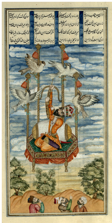
تصویر ۷- کیکاووس به آسمان پرواز می‌کند، شاهنامه عمادالکتاب، کاخ موزه گلستان.

افراد و اشیاء به لحاظ شکل، رنگ، اندازه، نوع جای‌گیری و حتی جهت‌مندی، آن مقدار است که باقی مؤلفه‌ها تحت الشعاع قرار می‌گیرد. این شبیه‌پنداری تا به آنجا پیش می‌رود که صرف‌نظر از تفاوت‌های جزئی در تجسم صورت و تاج شهریاری، سایر موارد بر یگانگی وجودی دو پادشاه دلالت دارد: جلوس فرمانروا بر تخت کیانی در میانه قاب با اندام بزرگ‌تر از سایرین مبتنی بر نظام شرح مقامی، آراستگی او به تاج مرصع و قبضه شمشیر، رجال سیاسی و خدای که در دوسوی او ترکیب قرینه ایجاد کرده‌اند، جایگاه مشابه که در نیمه راست هر دو قاب برای فردوسی و نوذر اتخاذ شده است، پس‌زمینه مشتمل بر پنجره‌های که درختی در میانه آن واقع شده و کاملاً بر محور پیکر شاه است، پرده‌های آویخته سرخ‌رنگ که سالن‌های تأثر را تداعی می‌کند و درنهایت تزیینات ستون‌وار، و همین‌طور گره‌چینی و مفرش آبی منقوش به طرح افشان، از مشهودترین موارد هستند. علاوه بر این، به دلیل پیروی از اسلوب پیکرنگاری درباری، صورت‌های تصنعی با نگاه خیره و بی‌جان به عوض تجسم حال و هوای روانی متفاوت حاکم بر هر دو صحنه بر مصادیق مشابهت دو پادشاه فزونی بخشیده‌اند. تنها تفاوت‌های بسیار اندک در چهره‌پردازی همچون استخوان‌بندی کاسه سر، تغییر فواصل چشم و ابرو یا جهت پیچش و تاب سبیل مردانه! بر حضور دو شخصیت مجزا گواهی می‌دهد و تمایز در رنگ پوشش، این اختلاف را تشدید می‌کند. البته در این نسخه از شاهنامه، رنگ، مؤلفه شخصی نیست یعنی ممکن است ردای هر پادشاه در مجالس متفاوت به هر رنگی دربیاید (که البته اینطور نیز شده است) اما به هر روی این تباین رنگی، خاصه در این قیاس