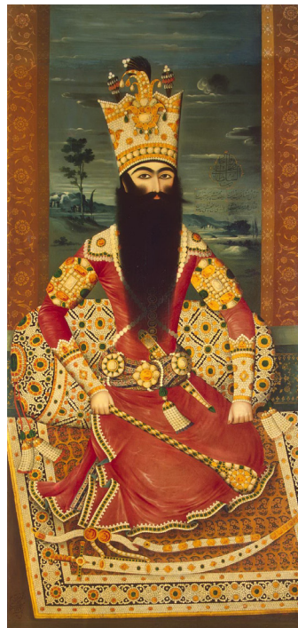
تصویر ۴- فتحعلی‌شاه، اثر مهرعلی، رنگ و روغن روی بوم، ۱۸۱۴/۱۲۲۹، موزه هرمیتاژ، سنت پترزبورگ. ماخذ: (URL2)

تصویر ۵، مطابق با بخش آغازین کتاب، سلطان محمود را نشان می‌دهد که فردوسی برابر او، شاهنامه را قرائت می‌دارد. تصویر ۶ اما، مجلس اندرز منوچهر پادشاه به نوذر را روایت می‌کند. در صحنه‌پردازی این دو تصویر، تأثیر ترکیب ایستا و توافق در چینش