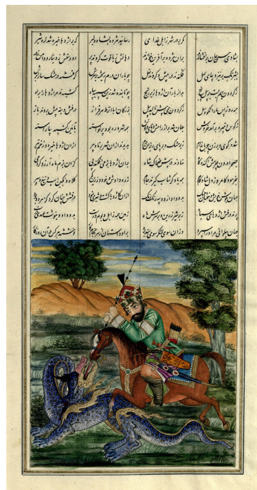
تصویر ۹- گرشاسپ اژدها را می‌کشد، شاهنامه عمادالکتاب، کاخ موزه گلستان.