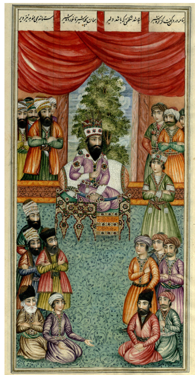
تصویر ۶- منوچهر پیش از مرگ به نوذر اندرز می‌دهد، شاهنامه عمادالکتاب، کاخ موزه گلستان.