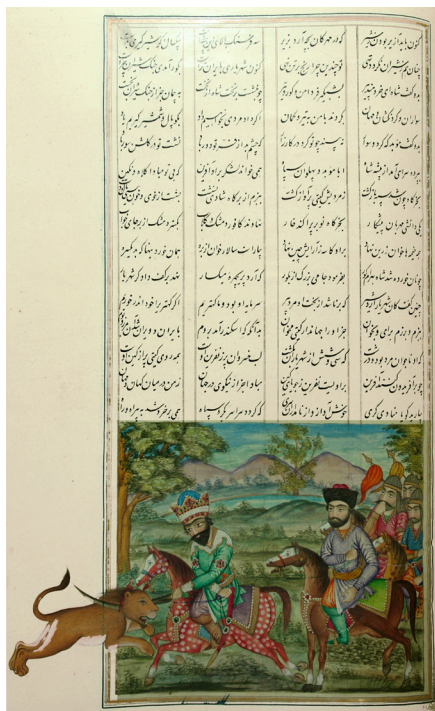
تصویر ۱۰- بهرام‌گور شیر را به دونیم می‌کند، شاهنامه عمادالکتاب، کاخ موزه گلستان.

در تصاویر ۷ و ۸، به ترتیب کاووس شاه و افراسیاب براریکه قدرت نشستند. در تصاویر پیشین، رخداد حادثه در فضای داخلی صورت می‌گرفت بنابراین الگوی واحدی در بیشتر اجزا به چشم می‌خورد؛ اما این شباهت در تصویر ۷ به واسطه تجسم داستان پرواز کیکاووس و تغییر مکان مجلس به فضای خارجی رو به افول می‌گذارد. البته اینبار نیز نقاش، به مدد تجسم کاووس شاه در میانه قاب و با ابعادی بزرگتر از سایرین، تجسم مردم با انگشت حیرت در پایین قاب، بهره‌گیری از تخت و پشتگاهی همچون سایر نمونه‌ها و حتی استواری طناب‌هایی که برخلاف خاصیت ذاتی خود، همچون آرایش ستون‌وار به استحکام ایستاده و با ترکیب خوشنویسی فوق‌برگه تقویت شده‌اند؛ به صورت خواسته یا ناخواسته نسبت به شبیه‌سازی و همگونی این نمونه با سایر صور پادشاهی این نسخه اقدام کرده است. این مسئله، شاهدهی است بر آنکه تصویرگر این نسخه، برای باز نمود فرمانروایان شاهنامه یک الگوی ساختاری مبنا و ضابطه‌مند را در ذهن می‌پرورانده که همچون پیکرنگاری‌های فتحعلی‌شاه، اصل آن بر تقارن و بزرگ‌نمایی مقام حاکم قرار داشته و بقیه موارد در یمن شکوه و تناسب آن به منصف ظهور می‌رسیده است. همانطور که به یقین، «نحوه پدیدار شدن هر جزء کم یا بیش به ساختار کل بستگی دارد و کل نیز به نوبه خود، تحت تأثیر اجزایش است و هیچگاه بخشی از یک اثر هنری به تمامی نمی‌تواند خود بسنده باشد» (آرنهایم، ۱۳۹۲، ۹۸). در تصویر ۸، افراسیاب بر تخت تکیه دارد تا در حضورش، سراز