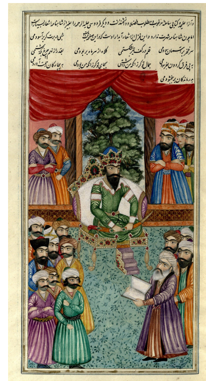
تصویر ۵- فردوسی شاهنامه را به سلطان محمود پیشکش می‌کند، شاهنامه عمادالکتاب، کاخ موزه گلستان.