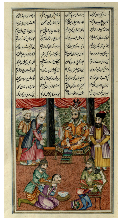
تصویر ۸- گروهی زره‌دودر حضور افراسیاب سرازتن سیاوش جدا می‌کنند، شاهنامه عمادالکتاب، کاخ موزه گلستان.