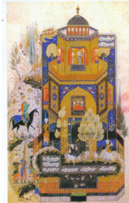
تصویر ۲- خسرو در مقابل قصر شیرین، خمسه نظامی، تبریز، حدود ۸۸۶ تا ۹۱۱ هجری، مجموعه کی‌یر، نیویورک.