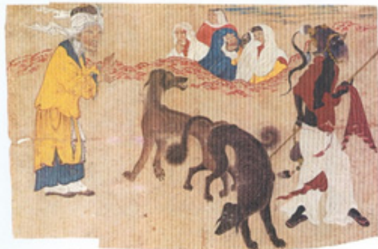
تصویر ۵- سگ بانان، مرقع سلطان یعقوب، کار شیخی، شماره H2153، توپقاپی سرای استانبول.

۲. بین دربار سلطان یعقوب و سلطان حسین بایقرا مناسبات و روابط دوستانه برقرار بود و گاهی بین دو دربار هدایایی رد و بدل می‌شد و حتی برای خرید هنرمندان و سخنوران کارهایی صورت می‌گرفت. بعید نیست که این آثار به عنوان هدیه از دربار سلطان حسین بایقرا برای سلطان یعقوب فرستاده شده و سلطان یعقوب هم دو هنرمند برجسته خود شیخی و درویش محمد را مامور فراهم آوردن این دو مرقع کرده است. بویژه گفتنی است که این آثار مخصوصاً آثار استاد محمد سیاه‌قلم، متعلق به دوره اول مکتب هرات بوده و برای سلطان حسین بایقرا که بیشتر گرایش‌های عرفانی را دنبال می‌کرده، جذابیتی نداشته است. شیخی و درویش