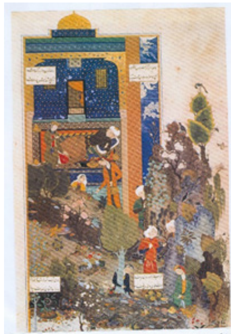
تصویر ۴- بهرام گور در کوشک زرد، خمسه نظامی ، تبریز، محرم ۸۸۶، کارشیخی، تویقایی سرای استانبول.

۱. خمسه نظامی ، کتابت عبدالرحیم یعقوبی السلطانی در تبریز در ۱۱ نگاره از شیخی یعقوبی و درویش محمد و ۹ نگاره هم در سال های نخستین حکومت شاه اسماعیل بدان افزوده شده است. این خمسه در تویقایی سرای استانبول با شماره H.762 نگهداری می شود. این خمسه همان خمسه ای است که نخستین بار، کتاب آرایبی آن در هرات طراحی شد، نیمه تمام بدست پیربوداق قراقویونلو افتاد. باز به اتمام نرسیده به دست سلطان خلیل آق قویونلو در شیراز افتاد. باز در دوره او هم به اتمام نرسید و بدست سلطان یعقوب در تبریز افتاد که یازده نگاره بدان افزود و در نهایت توسط شاه اسماعیل صفوی به اتمام رسید. ۲. خمسه نظامی ، اتمام کتابت در ۱۴ ربیع الثانی ۸۹۶، دارای