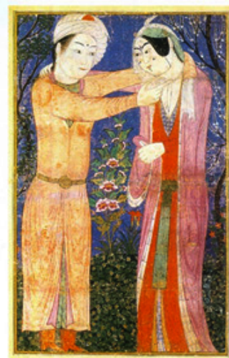
تصویر ۲- دودلداده، احتمالاً کار شیخی، حدود دهه ۸۵۵ هجری، تبریز، موزه متروپولیتن، نیویورک.

از عبارات یاد شده پیداست که سلطان محمد پیش از بهزاد در کتابخانه شاه اسماعیل کار می کرد و بوداق قزوینی از استادان قدیم نام می برد بعید نیست درویش محمد و شیخی بوده باشد که می گفته اند سلطان محمد روش قزلباشی را بهتر کار کرده و بخصوص در کلاه و لباس حیدری (کلاه دوازده ترک) و کشیدن اسب و اسلحه، مهارت و استادی به خرج داده و حتی در تصویر اسب از بهزاد پیشی گرفته است به طوری که قرینه استاد بهزاد شده است و این طبیعتاً در دوران پختگی او بوده است. می توان گفت که جوانی سلطان محمد در دربار سلطان یعقوب و در مجاورت استادان