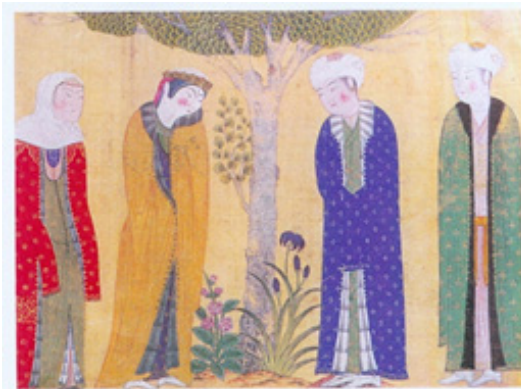
تصویر ۶- دو دل‌داده و ندیمه‌ها، احتمالاً کار شیخی، تبریز، حدود دهه ۸۵۵ هجری، مجموعه خصوصی، پاریس.