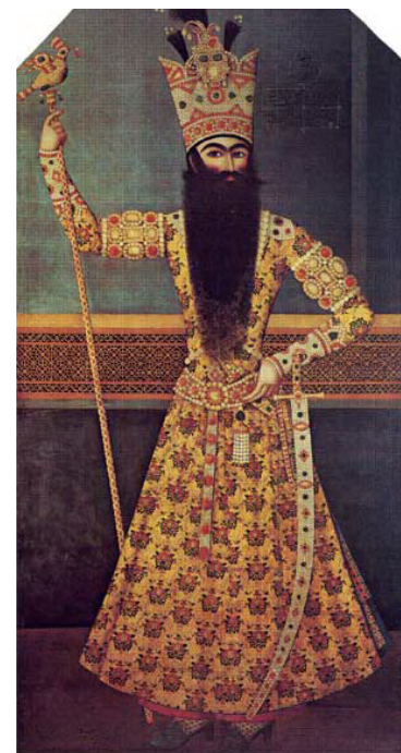
تصویر ۱- تصویر ایستاده فتحعلی‌شاه، اثر مهرعلی. ماخذ: (آژند، ۱۳۹۲، ج ۲، ۸۴۷).