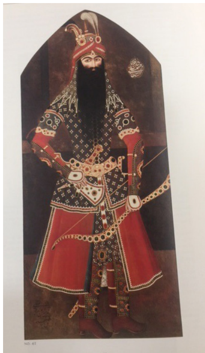
تصویر ۳- تصویر ایستاده فتحعلی‌شاه، اثر مهرعلی. ماخذ: (Diba, 1999, 186).

مهرعلی، شاگرد میرزا بابا و برجسته‌ترین نقاش دربار فتحعلی‌شاه بود. مهرعلی در کاربست میثاق‌های زیبایی چهره و اندام، در ساخت و پرداخت تاج، اسلحه، جامه و نیز طراحی و رنگ‌آمیزی، از