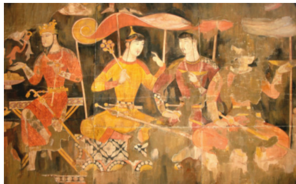
تصویر ۸- پنجکنت، بخشی از نقاشی دیوارنگاری، ضیافت. ماخذ: (آژند، ۱۳۹۲، جلد ۱، ۶۲۰)

۱- عناصر عمودی، افقی، مورب و منحنی، تلفیق نقش‌مایه‌های تزئینی و تصویری؛ رنگ‌گزینی محدود با تسلط رنگ‌های گرم؛ کمر باریک و شانه پهن؛ رخسار جوان؛ تاج؛ عصای مرغ نشان؛ خنجر و شمشیر؛ خفتانی از پوست پلنگ؛ جامه فاخر و مملو از جواهرات بویژه مروراید از ویژگی‌های عینی پیکره‌های انسانی مصور شده در سپر چوبی، سکه و نقاشی‌های دیواری پنجکنت به شمار می‌آیند.