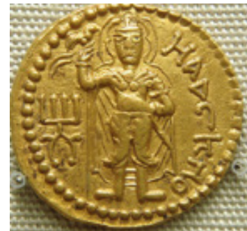
تصویر ۵- کوشان، سکه، هاویشکا با عصای مرغ نشان در دست راست.