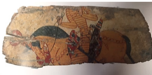
تصویر ۴- سغد، سپر چوبی.

با فروپاشی سلوکیان، حدود سده‌ی دوم پیش از میلاد، سرزمین سغد تحت سیطره‌ی کوشانیان درآمد. حاکمان کوشان را عمدتاً می‌توان از روی سکه‌های شان شناخت، زیرا هر