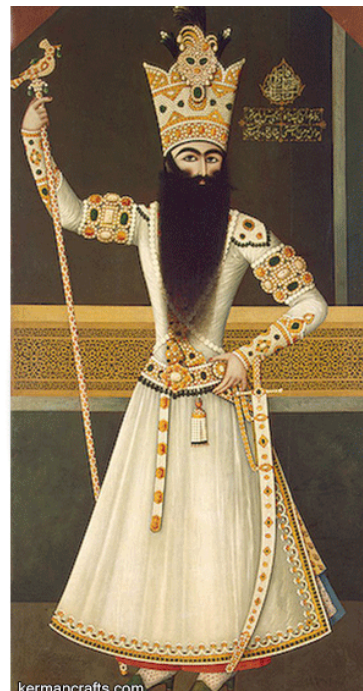
تصویر ۲- تصویر ایستاده فتحعلی‌شاه، اثر مهرعلی.