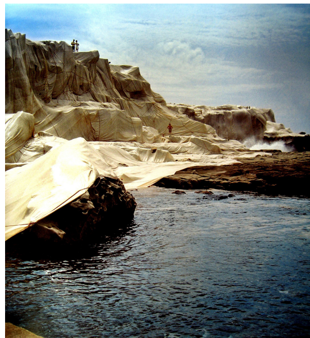
تصویر ۴- ساحل بسته‌بندی شده، کریستو، ۲۰۰۷، مکان: ساحل شمالی سیدنی در استرالیا. مأخذ: (Lailach, 2007, 20)

هاچینسون ۱۹ معتقد است در دوره‌های جغرافیایی مختلف، فرود شهاب سنگ‌ها، سیل، طوفان و فرسایش به طور مداوم سطح زمین را ساخته، خراب کرده، چاله ایجاد کرده، هموار کرده و یا شکل به آن بخشیده است. فن هنر از نظر او عبارت است از ترکیب سطح زمین که توسط وقایع طبیعی اتفاق افتاده. در پروژه‌ای، گل‌های زیردریایی را درست کرد (تصویر ۵). هاچینسون، گل‌ها را روی سطح مثلی شکل کف اقیانوس کاشت. او هدف خود را از کاشت گل‌ها در کف دریا، استفاده از فضای آزاد که به کسی تعلق ندارد، خواند. ساختار شکنی در این اثر به این شکل است که در کف دریا گل وجود ندارد. هاچینسون عکس‌های رنگی و بزرگی را از اثری که در کف دریا