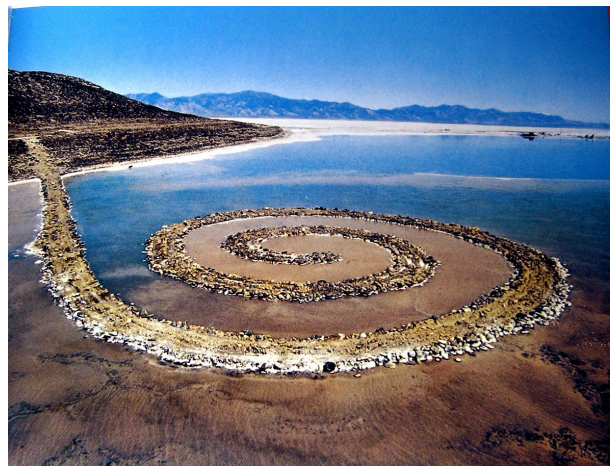
تصویر ۶- اسکله حلزونی، رابرت اسمیتسون، ۱۳۹۲، مکان: دریاچه نمک یوتا. مأخذ: (لچت، ۱۳۹۲، ۱۳۷)

اسکله‌ی ماریپچ نیز نمونه شناخته‌شده‌ای از رابرت اسمیتسون ۲۴ است که با استفاده از سنگ‌های مرمر، تخته سنگ‌ها، گل و لای، کریستال نمک و خزه‌ها، در دریاچه بزرگ نمک یوتا ساخته شد (Lailach, 2007, 88). "اسکله‌ی ماریپچ، شیفتگی اسمیتسون را به اماکن جغرافیایی و تعبیر گسترده‌ی او از آنتروپی (میزان بی‌نظمی، یا تصادف در یک منظومه) به هم می‌آمیزد تا اثری با معنای پیچیده و زیبایی گیرا بیافریند (تصویر ۶). شکل ماریپچ، نمادی قدرتمند از خود زندگی می‌شود که مدام به سوی بیرون گسترش می‌یابد، در حالی که هم‌زمان از درون کاسته می‌شود. اسمیتسون با این تشخیص که تعداد انگشت شماری ممکن است از آن محل دیدار کنند، خواست تا فیلمی بسازد که از روند کار سندی فراهم آورد و عقاید خود را با تماشاگران در میان بگذارد" (اسماگولا، ۱۳۸۱، ۴۰۸). این مجسمه‌ی بزرگ بین سال‌های ۱۹۷۲ تا ۱۹۹۳ در آب فرو رفت (Lailach, 2007, 88). عده‌ی اندکی موفق به دیدن اثر مزبور شدند و با توجه به دورافتادگی آن در قلب کویر، حتی در خلال چند سالی که اسکله به طور کامل به زیر آب نرفته بود نیز امکان محدودی برای تماشای آن از نزدیک وجود داشت. در واقع آنچه که همگان دیده‌اند، تنها به تصاویر و مستندات این پروژه عظیم و عکس معروفی از فراز آن که در اکثر منابع تاریخ هنر معاصر چاپ شده، امکان پذیر است (سمیع آذر، ۱۳۹۱، ۲۱۲). هدف هنر، انتقال حس چیزهاست آن سان که ادراک می‌شوند، نه آن سان که دانسته می‌شوند. هنر با ایجاد اشکال غریب و با افزودن بردشواری و زمان فرایند ادراک، از اشیاء آشنایی‌زدایی می‌کند (مکاریک، ۱۳۹۳، ۱۳). رومن یاکوبسن، در دفاع از فرمالیست روسی اعلام کرد: آنچه ما کوشیده‌ایم نشان دهیم این است که