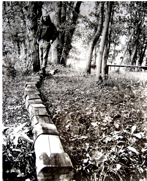
تصویر ۱- تکه های الوار، کارل آندر، مکان: اسپین کلارادو، ۱۹۶۸. مأخذ: (Lailach, 2007, 26).

یک ایده، اندیشه ای است که از طریق پیوند دو مفهوم که از پیش با یکدیگر نامربوطند، برانگیخته می شود. هم کناری، الگوهای جدید و رابطه های جدیدی را تشکیل می دهد و روش جدیدی از مشاهده اشیا ایجاد می کند. این پدیده، به عنوان ایجاد ناآشنای آشنا و آشنای ناآشنا، توصیف شده است. یک ایده خلاق، دربرگیرنده یک ایده ی ذهنی است. به جای بدیهی دیدن، یک