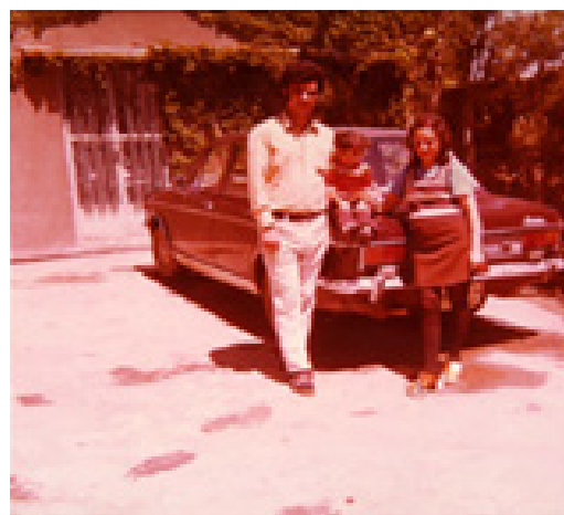
تصویر ۲- درون‌مایه پوشش و کالا.