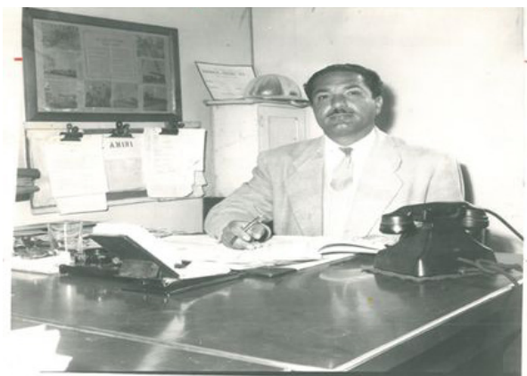
تصویر ۱- درون‌مایه‌ی انضباط.

«جنبش‌های توده‌ای که بر گفتمان بازگشت به اصل استوار بودند، معمولاً در شرایط زیر- که شرایط بیشتر انقلاب‌های قرن بیستم است - پدید آمدند؛ مدرنیزاسیون سریع و از بالا، رواج شهرنشینی از بین سبک‌های سنتی زندگی و بالاخره، مغلوب سلطه نیرومند خارجی شدن» (میرسپاسی، ۱۳۹۲، ۲۵۹). در ایران نیز به دلیل شرایط سیاسی، اجتماعی، فرهنگی که همه معلولان تقابل جامعه‌ی سنتی ایران با پدیده‌ی مدرنیته‌ی غربی‌اند، چنین گفتمان درون‌مرزی شکل می‌گیرد. در واقع، «ظهور دولت نوین و اقتدارگرایی پهلوی، مدرنیزاسیون از بالا و پدید آمدن از خود بیگانگی در میان جماعت مهاجر شهری از عواملی هستند که شرایط اجتماعی - سیاسی را برای ظهور ایدئولوژی "بومی‌گرا"یی که مبتنی بر نظریه "بازگشت" است، مهیا می‌کند» (همان، ۲۰۱). بازتاب