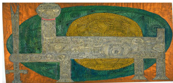
تصویر ۳- مکتب سقاخانه اثر حسین زنده‌رودی.