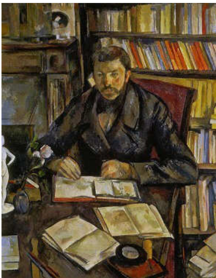
تصویر- پرتوی گوستاو ژوفرای، ۱۸۹۵ م. رنگ و روغن روی بوم، ۸۹*۱۱۰ سانتیمتر، موزهی ارسی، پاریس.

از سوی دیگر، آرمانی‌ترین گونه‌ی ادراک بصری و نگاه، تحت عنوان "نگریستن از همه جا" یا نگاه از همه جا مطرح می‌شود که مطلوب‌ترین نظرگاه برای ادراک ابژه بوده و انتظار می‌رود در آن، حداکثر دریافت حاصل شود. اما این نوع نگریستن امکان‌پذیر نیست، چرا که هیچ دیدگاه واحدی وجود ندارد که با داشتن آن، ابژه به حداکثر ظهور رسیده و به صورت کامل و سه بعدی در دید آشکار گردد. پس این نوع نگریستن، وضعیتی دست‌نیافتنی و دور از دسترس بوده که انسان همواره خود را نسبت به آن، دارای انحراف می‌داند. علیرغم وجود این انحراف و امکان‌ناپذیری نگاه از همه جا از جمله به هنگام نگریستن به نقاشی، ارتباطی دوسویه بین اثر و مخاطب، همچنین تابلو و نقاش برقرار می‌شود. این باور هم وجود دارد که نقاشی‌ها که اشیاء جهان را مجسم می‌کنند، خود نیز به‌عنوان نوعی شیء محسوب می‌شوند (کارمن، ۱۳۹۱، ۴۴۹ و ۴۴۰). به‌علاوه چنانکه مرلوپونتی می‌پندارد، در این جهان اشیاء یکدیگر را می‌بینند؛ پس