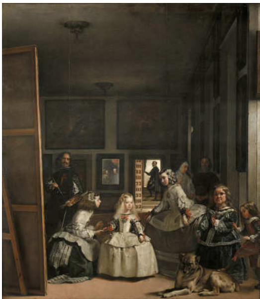
تصویر ۲- ندیمه‌ها، دیه‌گو ولاسکس، ۱۶۵۶م. رنگ و روغن روی بوم، ۲۷۴*۳۲ سانتیمتر، موزه‌ی پرادو، مادرید، اسپانیا.

ذات انسان در بدن مندی او تعریف می‌شود که نسبت بدن با جهان، همچون قلب برای یک پیکر است که به آن هستی بخشیده و به همراهش یک نظام ۴۱ را تشکیل می‌دهد. تعبیر جالب مرلوپونتی از بدن، "نقطه‌ی صفر" است؛ به این معنا که سرآغاز تمام ادراکات و تجربیات آدمی است. همچنین به هنگام ادراک، بدن