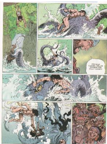
تصویر ۱۲- تورکال.

معروف‌ترین اثری که بی‌شک ملیت بلژیکی دارد، بانددسینه‌ی اسپرو است. اسپرو، پسر بچه‌ی پادوی یک هتل است که رفتاری بسیار شبیه به تن‌تن دارد (شجاعی طباطبایی، ۱۳۷۵، ۹). او در اولین داستان از داخل یک بوم نقاشی جان گرفت و بیرون آمد. داستان از این قرار بود که رییس یک هتل برای استخدام خدمتکار یک آگهی چاپ کرد و عده‌ی زیادی برای استخدام نزد او آمدند. رییس که از عهده‌ی مصاحبه با تک‌تک این افراد بر نمی‌آمد، فکری