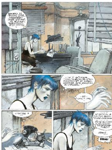
تصویر ۶- ل پم پیژ.

بالون‌های گفت‌وگو در این داستان‌ها به فرم مربع یا مستطیل با خطوط کناره‌نمای موج و گاه با شکست‌های مختصر همراه است و متن داخل بالون‌ها به صورت دست‌نویس و تماماً با حروف بزرگ نوشته شده است. در اولین قسمت‌های این باند دسینه، کمتر با افکت‌های صوتی مواجه می‌شویم و گاه آنها در قالب حرفی نازک و بزرگ‌تر از نوشتار بالون‌ها مشاهده می‌شوند اما به مرور زمان که