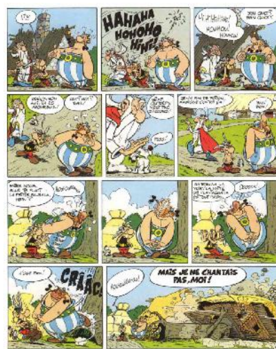
تصویر ۱۰- استریکس.