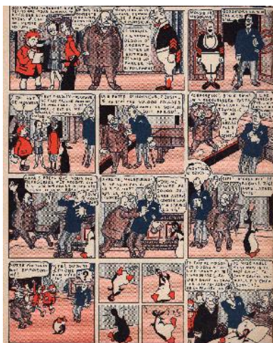
تصویر ۳- زیگ اِپوس.

لی پیه نیکلز نیز مسیر مشابهی را پیش گرفت و البته عمر طولانی‌تری نسبت به پکاسین برایش رقم خورد. در ابتدا این اثر