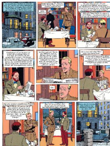
تصویر ۱۱- بلیک اِمورتیمور.