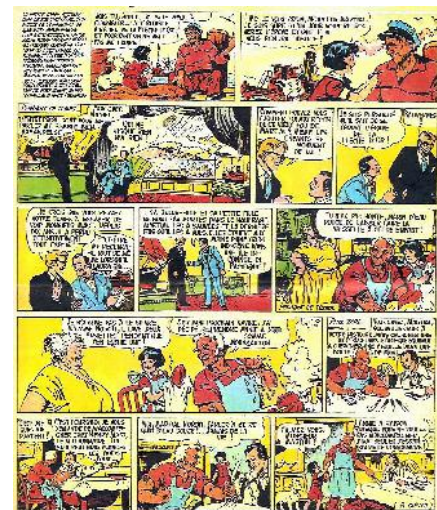
تصویر ۴- ل پتی آنی.