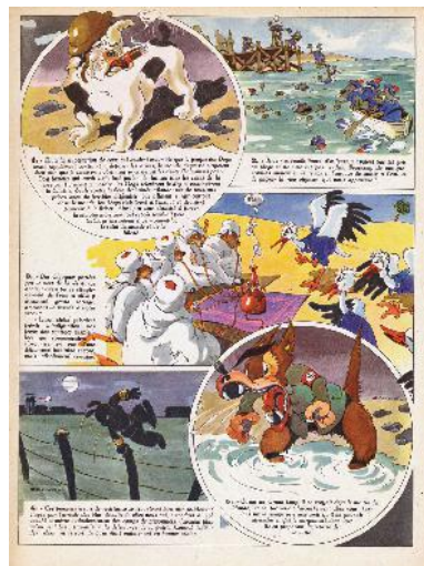
تصویر ۵- ل پت اِ مُرت.