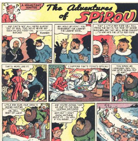
تصویر ۹- اسپیرو

یکی از داستان‌های مشهوری که در این نشریه برای اولین بار معرفی شد، بلان‌دین اسپیرو نام داشت. باند‌دسینه‌ی محبوبی که توسط هرژه ۲۶ در سال ۱۹۳۹ طراحی شد (URL 12). بلان‌دین یک پسر سفیدپوست با موهای بلوند و سیرز سیاه‌پوست است. این دو دوست با یکدیگر ماجراهای پلیسی و متفاوتی را پشت سر می‌گذارند؛ از مواجه شدن با گانگسترهای آمریکایی گرفته تا حل معمای پرواز بشقاب‌پرنده‌ها. بلان‌دین یک قهرمان واقعی است. چیزهای زیادی می‌داند و مسائل را با هوش زیادش حل می‌کند اما قهرمان اصلی این مجموعه، سیرز است (URL 6).