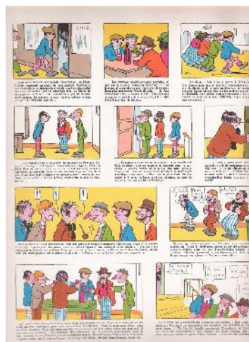
تصویر ۲- لی پیه نیکلز.