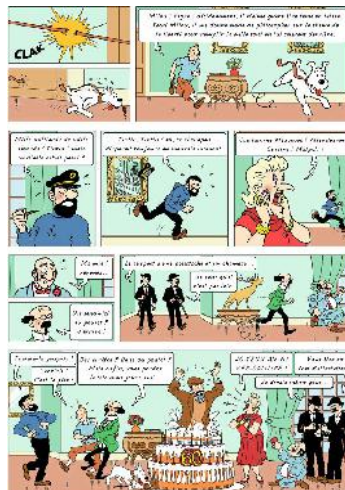
تصویر ۸- تن‌تن