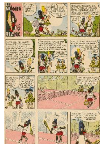
تصویر ۷- بلان‌دین اسپیرو