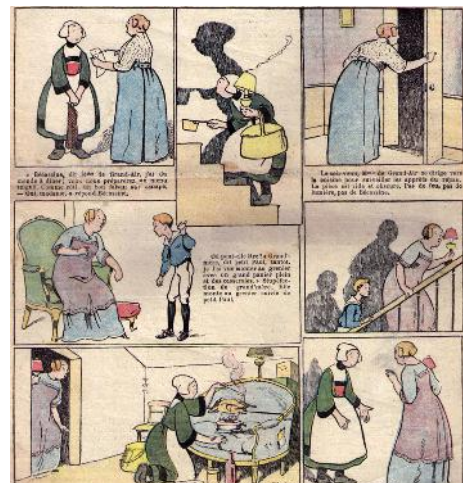
تصویر ۱- باند‌دسینه پکاسین.