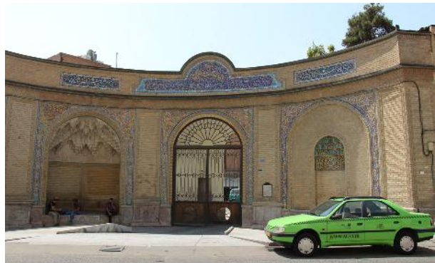
تصویر ۲- وضعیت کنونی کتیبه‌های سردر کالسکه رو.