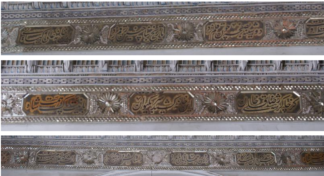
تصویر ۱۲- بخشی از کتیبه‌های سرسرای دیوان خانه.

بر روی جهانیان باعزاز ز آسایش و امن شد دری باز دوشینه بصفحه چون رقم زد تاریخ بنا چنین رقم زد این خانه عالی کیانی برپا ماند و جاودانی بخش غربی مشتمل بر چهار بیت و هشت قاب: بخ بخ ز سرای ظل السلطان وین سردر و این بلند ایوان مانند بنا عشق محکم همچون دل شاه خالی از غم پهلوی زده است آسمان را آرایش از آن بود جهان را رضوانش سزد بخاکروبی کز خلد سبق برد بخوبی بخش جنوبی مشتمل بر هفت بیت و چهارده قاب: طوقش ز تفرج جهان به طاقش ز رواق آسمان به سرمایه از آن خزانها را رب النوع است خانها را بردرگه این بلند طارم روی همه خاصه من هم چون روی همه بود به سوبش محراب کسی شد است کوبش بی واهمه شاید ار در اسلام خود کعبه ثانیست نهم نام اسکندر اگر که زنده ماندی آئینه سقف آن نشاندی