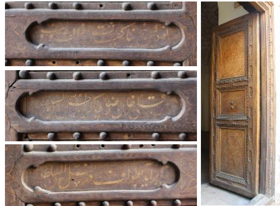
تصویر ۷- کتیبه‌های در چوبی معرق سردر پیاده.

این کتیبه مشتمل بر اشعاری است که پشت شیشه به خط نستعلیق نوشته شده و بر متن کاغذی مطلا و در آیینه‌کاری در کادر