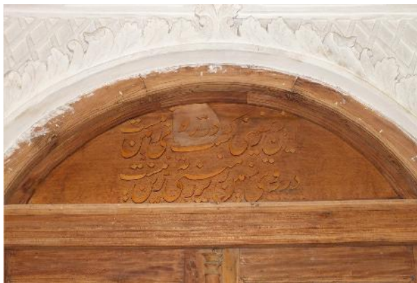
تصویر ۱۰- کتیبه زیرزمین پس از مرمت.

بعهد دولت جمجاه ناصرالدین شاه که بر شده ز فلک صیت عدل و احسانش به یمن دولت شاهنشاه جهان مسعود که خوانده شاه جهاندار ظل سلطانش بنا نهاد بری این عمارت عالی که برگزیده برفعت ز عرش ایوانش الله محمد علی فاطمه حسن و حسین به کامرانی و اقبال بنده درگاه رضاقلی یکی باشد از غلامانش نمود جهد به پایان رساند این خدمت که باد ایمن ز آسیب دهر بنیانش