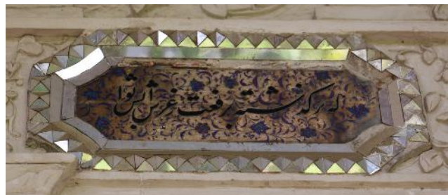
تصویر ۸- بخشی از کتیبه‌های ایوان شرقی ساختمان مشیرالملکی.