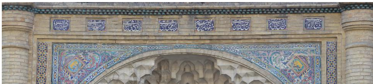
تصویر ۵- کتیبه سردر پیاده، بر فراز مقرنس و مشتمل بر هشت لوح کاشی.

تاریخ سال و بانی او جستم از خرد این بنا مرتفع که ندیده است آسمان مسعودیه نهاد مرا این قصر را بنام یا باب شهر علم نبی مرتضی علی دار این بنای عالی مفتوح و منجلی بحریست در عطا و بر هر دریست پلی