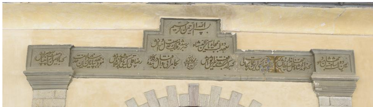
تصویر ۱۱- کتیبه های سردر ورودی سنگی دیوان خانه.

با طالع سعد و بخت سرمد بد پنج کم از هزار و سیصد کز چاکر شه رضاقلی خان این خانه کشید سر به کیوان با نیت پاک همت شاه بر چرخ زد این بلند خرگاه