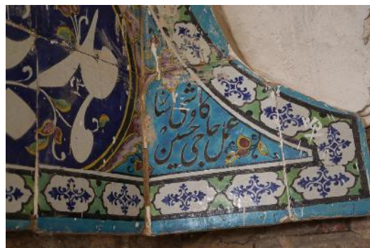
تصویر ۴- کتیبه اولیه سردر کالسکه رو، واقع در زیر زمین، نام کاشی‌ساز و کتیبه‌نگار.