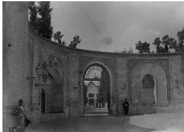
تصویر ۱- تصویر سردر کالسکه رو در زمان قاجار.

کاشی‌کاری و نقاشی روی کاشی‌های سردر باغ ملی تهران نیز از آثار استاد حاج حسین کاشی‌پز است. استاد حاج حسین تا سال ۱۳۲۰ ه. ش. فعال بود و پس از آن فرزندان کار او را ادامه دادند (مکی نژاد، ۱۳۸۸، ۸۱). از آنجایی که این کتیبه حدود ۴۸ سال