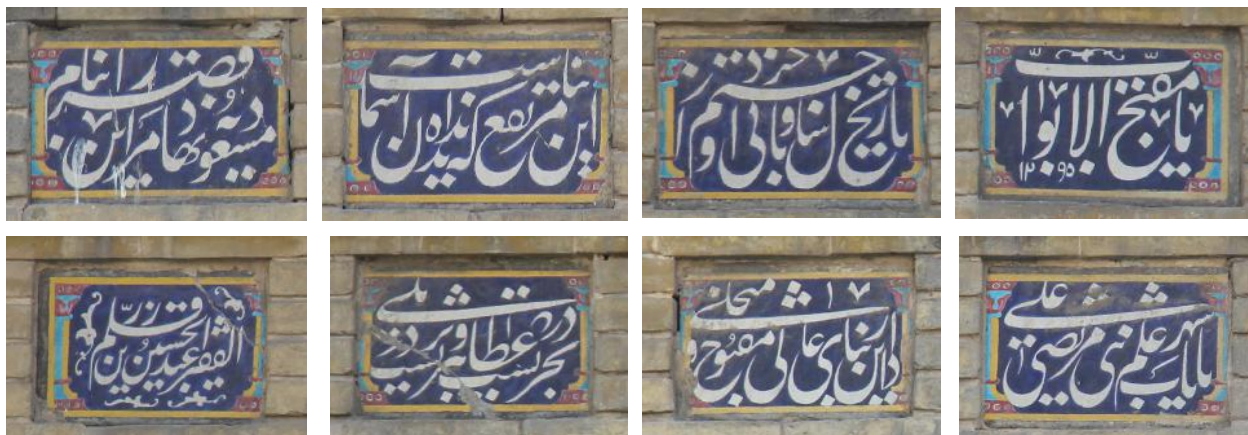
تصویر ۶- کتیبه سردر پیاده بر فراز مقرنس مشتمل بر هشت لوح کاشی.