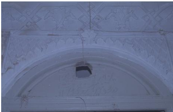
تصویر ۹- کتیبه زیرزمین پیش از مرمت.

بر هلالی سردر چوبی شرقی زیرزمین عمارت مشیرالملکی، کتیبه‌ای منبت‌کاری شده به صورت برجسته به خط نستعلیق به شرح زیر موجود است که کاتب آن نامشخص است (تصاویر ۹ و ۱۰). این زیرزمینی است [که در روی زمین نیست در روی زمین زیرزمینی به [ ] زمین نیست