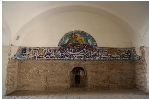
تصویر ۳- وضعیت کنونی کتیبه اولیه سردر کالسکه رو، واقع در زیر زمین.