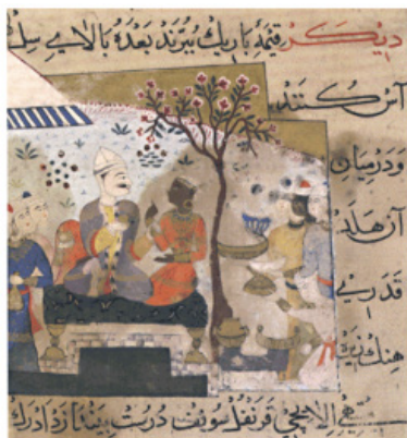
تصویر ۷- طرز تهیه کوفته. (Titley, 2005, 90)

شاه به همراه ملازمان در زیر سایه بان نشسته است. زن در کنار سلطان هند با گوشواره ای آویز نشسته است. در سمت راست سلطان تعدادی خدمه با چهره ایرانی در حال پذیرایی و خدمت به وی هستند. دو زن در حال آشپزی بر روی زمین نشسته و دستور طبخ شربت و حریره را نوشته‌اند. در این نگاره نیز حکومت هند و دربار سلطان غیاث‌الدین به عنوان یک فضای نشانه‌ای در مواجهه با یک نوع غذای ایرانی که از مرز نشانه‌ای عبور کرده و به فضای درون وارد شده است، آن را ضمن سازوکار ترجمه، از طریق استفاده از سبک طبخ ایرانی، مورد جذب قرار می‌دهد.