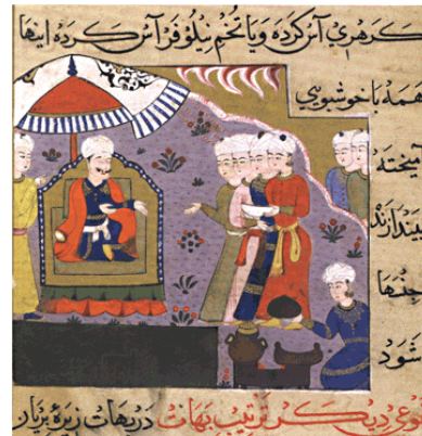
تصویر ۶- طرز تهیه سوپ و ادویه کاری. (Titley, 2005, 44)