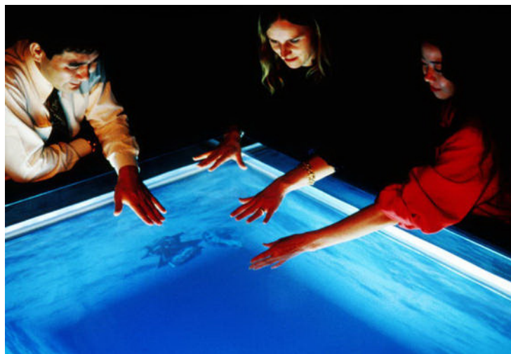
تصویر ۱- مخاطبان در حال تعامل با اثر. مأخذ: https://www.digitalartarchive.at/database/general/work/a-volve.html . تاریخ دسترسی: ۹۵/۱۲/۱۱

به کمک چارچوب نظری که توسط آراء دیویی طراحی کردیم به غیر از درک هنر تعاملی به صورت کلی که در بخش‌های قبل به تفصیل شرح داده شد، می‌توان در بررسی و ارزیابی نمونه‌های متفاوت و مشخصی از هنر تعاملی نیز دست یافت. در این قسمت نیز تلاش شده است با استفاده از این الگو به خوانش نمونه‌ای از هنر تعاملی بپردازیم. کریستا سامرر و لارنت میگنونو هنرمندان شناخته‌شده‌ای هستند که در حوزه تولید هنر تعاملی از پیشگامان بوده‌اند و در حال حاضر نیز در حال فعالیت هستند و این امر