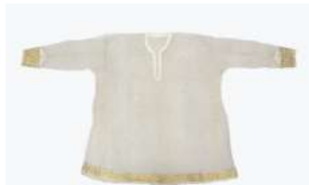
تصویر ۳-الف. لباس تور زردوزی شده.