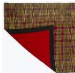
تصویر ۱۹- بقچه ابریشمی.