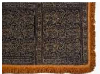
تصویر ۱۸- بقچه ترمه رضا ترکی.

این پارچه، چادرشب و متعلق به اواخر دوره قاجار می‌باشد (تصویر ۱۷). طرح آن پیچازی (چهارخانه) است. طرح‌های پیچازی به مرور