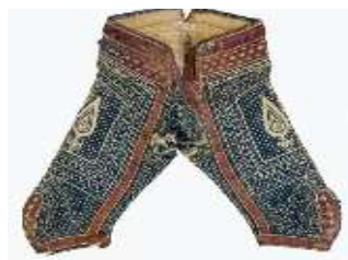
تصویر ۱۰-ب. طرح نام بافنده.