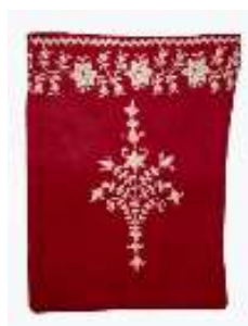
تصویر ۲۰- کیسه پول.