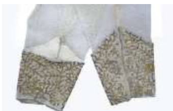
تصویر ۳-ب. نقوش سرآستین و حاشیه.