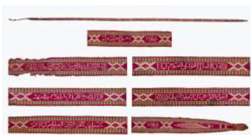
تصویر ۵- نوار آیه‌الکرسی ابریشمی.

نوار مبارک باد ابریشمی (تصویر ۴) متعلق به دوره صفوی، ظاهراً به‌عنوان کمربند در مراسم عروسی کاربرد داشته است. این نوع نوارها غالباً به منزله «بند» برای بستن هدایا، رختخواب پیچ، حمایل برای حمل باروتدان، بند شلوار، بند قنطاق و غیره به کار می‌رفته است. طرح آن شامل مجموعه طرح‌های گلدانی، سرو و پرونده و طاووس ۱۰ می‌باشد. نقوش آن عبارت است از: نقش هدهد (نماد خوشبختی)، نقوش طاووس، سرو و هدهد و درخت زندگی ۱۱ (نماد بهشت) و برسمدان - ظرفی که آتش مقدس در آن نگهداری می‌شود - (نماد روشنی و به‌روزی). نقش‌های به کاررفته در این نوارها بستگی