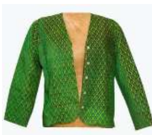
تصویر ۲-کت مخمل زنانه.