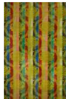
تصویر ۱۵- زیرمنقلی زرینفت.