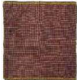
تصویر ۱۷- چادرشب.