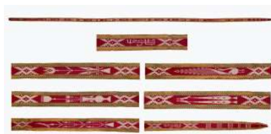
تصویر ۴- نوار مبارک باد ابریشمی.