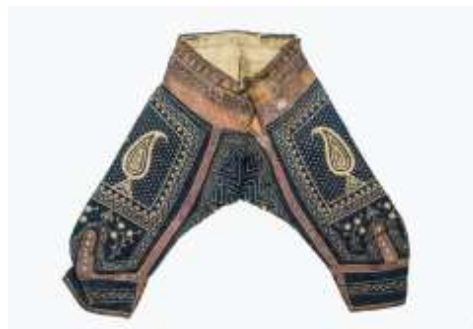
تصویر ۱۱- شلوار پهلوانی.

کت (زنانه)، از جنس اطلس زربافت و متعلق به دوره قاجار می‌باشد (تصویر ۱۲). رنگ زمینه آبی است که دسته گل‌هایی با استفاده از گلابتون سیمین بر آن نقش بسته است. آستر این کت از جنس قمیز است. قمیز نوعی ابریشم تک‌رنگ بوده که عموماً به‌عنوان آستر به کار می‌رفته است.