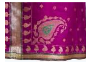
تصویر ۱۳- لباس زربفت زنانه.