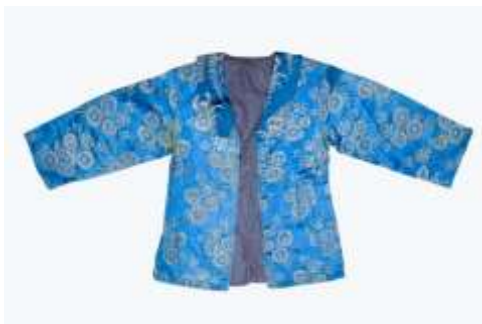
تصویر ۱۲- کت اطلس زربفت زنانه.

چادر سفید کتان و رودوزی شده، متعلق به اواخر دوره قاجار می‌باشد. نقش درخت زندگی در بالای سر قرار گرفته (تصویر ۱۴-الف) و نقش گل‌های تک و دسته‌گل در حاشیه و سرتاسر پارچه با استفاده از تکنیک ساتن‌دوزی ۱۳ دوخته شده است (تصویر ۱۴-ب). با توجه به نقش درخت زندگی ممکن است این چادر متعلق به عروس بوده باشد؛ اما با در نظر گرفتن مواد ارزان قیمت (کتان)، در تهیه این چادر نمی‌توان بر این نکته