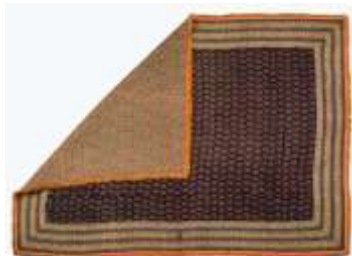
تصویر ۶- بقچه ترمه انگشتی پشمی.