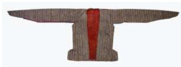
تصویر ۱-الف. اراخالق زنانه.