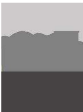
تصویر ۱-۲. سه فضای مجزا در ترکیب‌بندی نگاره تیموری.

تصاویر روایی با حضور بردار تشخیص داده می‌شوند و نقش مهمی در روایت تصویر دارند. بردار اغلب خطی فرضی است که مشارکت‌کنندگان را به یکدیگر پیوند می‌دهد و بیانگر نوعی ارتباط فعال و پویا در تصویر است. بردارهای کنشی به پرسش‌های متن تصویری پاسخ می‌گویند و نقش فعالانه و یا منفعلانه‌ی مشارکت‌کنندگان در تصویر را نمایان می‌کنند (Jewitt & Oyama, 2001, 140-143). این بردارها ممکن است توسط بدن‌ها، اعضا یا ابزارها تشکیل شوند؛ اما روش‌های دیگری نیز برای تبدیل عناصر بصری به بردار وجود دارد، برای مثال جاده‌ای که به‌صورت مورب در فضای تصویر نشان داده‌شده، یک خط بردار است (Kress & Van Leeuwen, 1996, 59). در ادامه باید اشاره کرد که ساختار روایتی می‌تواند گذرا یا ناگذرا باشد؛ چنان چه کنش از شخصی بر شخص دیگر انجام شود و هم کنشگر و هم کنش‌پذیر آشکار باشند گذرا است و اگر تنها یکی از طرف‌های کنش در تصویر قابل‌رؤیت باشد، ناگذرا محسوب می‌گردد. بر این اساس بردار نگاره تیموری (تصویر ۱)، توسط کنش نگاه مشارکت‌کنندگان به دال مرکزی (حضرت سلیمان (ع)) و تبادل نگاه میان شرکت‌کننده‌های