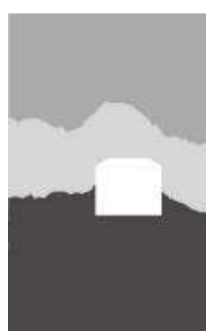
تصویر ۱- قاب بندی در نگاره تیموری.