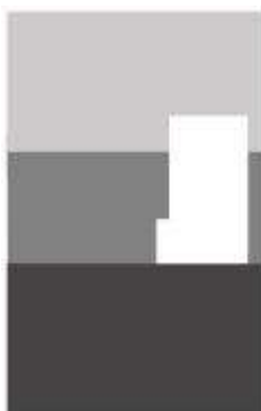
تصویر ۲- قاب بندی در نگاره صفوی.