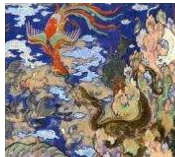
تصویر ۱-۲. بخشی از نگاره صفوی. تقابل نمادین لاهوت و ناسوت در آسمان.