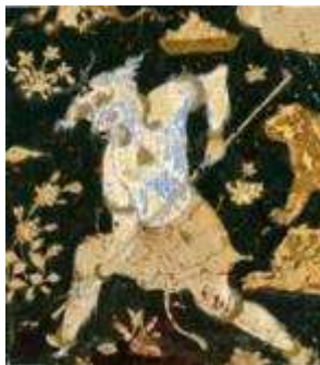
تصویر ۲-۴. افعال بدی پیکره های فرودست در نگاره صفوی.

ارزش اطلاعاتی در بررسی نگاره ی دوم بدین شکل تبیین می شود که پیکره سلیمان به عنوان شخصیت اصلی در فضای نسبتاً مرکزی تصویر شده و باقی مشارکت کنندگان مطابق با آن- به عنوان هسته اطلاعات- ساماندهی شده و تابع وی هستند. به عبارتی دیگر «عناصری که در حواشی تصویر قرار دارند فرعی و وابسته اند» (Kress & Van leeuwen, 1996, 206). هم چنین سلیمان بالاتر و تا اندازه های بزرگ تر از دیگران