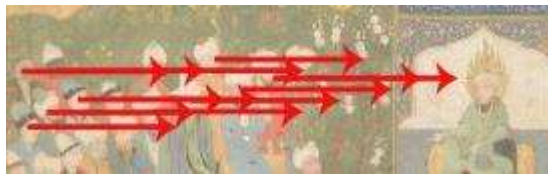
تصویر ۱-۶. بخشی از نگاره تیموری. زاویه دید افقی.

واکوی فراتنش تعاملی در دو قاب بالایی و پایینی نگاره‌ی تیموری (تصویر ۱) زاویه‌ی دید عمودی- به ترتیب از بالا به پایین و برعکس- است که مشارکت‌کنندگان به نقطه‌ی عطف نقاشی- پیکره سلیمان- دارند، یعنی آنجا که پرندگان به‌عنوان تمثیلی از جان آدمی به‌سوی اعلی‌ترین درجات