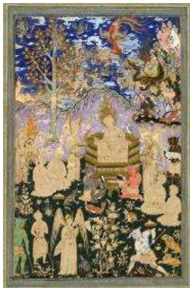
تصویر ۲- بارگاه سلیمان، متعلق به سده ۱۶هـ.ق (مکتب قزوین صفوی).