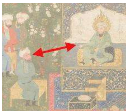
تصویر ۱-۱. بردار روایی و حرکتی شکل‌گرفته در نگاره تیموری.