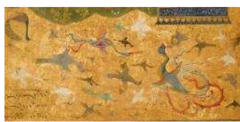
تصویر ۱-۳، ۱-۴ و ۱-۵. بخشی از نگاره تیموری. الگوی مفهومی؛ زیرمجموعه نمادین.

جدول ۲- فرانقش بازنمودی در نحو بصری نگاره‌ها.