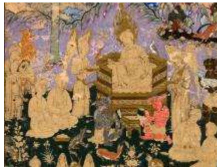
تصویر ۲-۴. مدالیته ی پایین در پیکره های طراحانه نگاره صفوی.