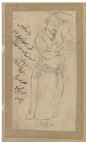
تصویر ۱۰- «زائر مشهد»، منسوب به رضا عباسی، ۱۰۰۶ ه.ق. مأخذ: (کنبی، ۱۳۹۳، ۵۹).