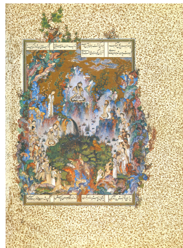
تصویر ۱- بارگاه کیومرث. اثر محمد سلطان، حدود ۹۳۱ ه.ق. مأخذ: (Mariani, 2011, 13)

درواقع اقتصاد هنر آن دوران نیز اساساً بازنمودی از این شرایط بود. به‌طورکلی نقاشان نمی‌توانستند آزادانه کار کنند، چون نه بازار هنر پویا و پرقدرتی وجود داشت و نه حامیان متنوع. غالب آثار نقاشی باقیمانده از