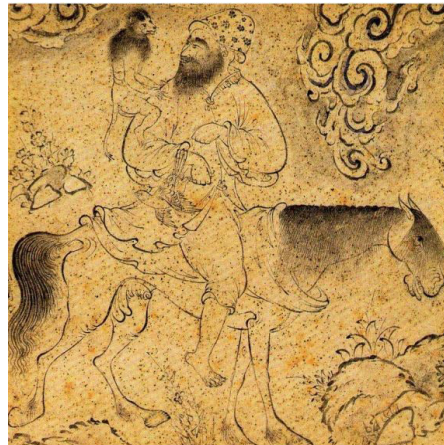
تصویر ۵- معرکه‌گیر، منسوب به رضا عباسی، قرن ۱۱ هجری. مأخذ: (کنبی، ۱۳۹۳، ۸۲)

تصویر (۶) اثری از «معین مصور» است که در آن «رضا عباسی» در حال کشیدن پرتزهای فرنگی است. معین مصور یکی از چهره‌نگاران معروف زمانه خود، از نقاشان کارگاه‌های درباری محسوب نمی‌شد. این اثر در سال ۱۰۴۴ «آبرنگ گردیده بود»، اما چهل سال بعد معین مصور آن را تکمیل می‌کند و شرح این تکمیل را با مدح رضا عباسی در حاشیه تصویر می‌نگارد. این تصویر و تصاویری از این دست در آن روزگار را می‌توان نشانه‌های دانست از گسترش روزافزون اهمیت «نقاش» و «نقاشی کردن». به شکلی که