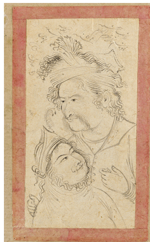
تصویر ۹- «دو دل‌داده» رقم معین مصور، ۱۰۵۲ ق. محفوظ در گالری فریبر.