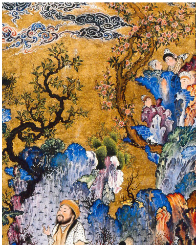
تصویر ۲- بزرگ‌نمایی بخشی از اثر «بارگاه کیومرث».

تخمین نظری از زمان متوسط برای اجرای هر نگاره در این دوران بسیار جالب‌توجه است. به نظر وی هر استاد برای ساختن یک مجلس کمتر از نیم‌سال وقت صرف نمی‌کرد. در اینجا باید در نظر گرفت که یک استادکار تنها ترکیب‌بندی کلی، انتخاب رنگ، ترسیم تصویر و کشیدن بخش‌های پیچیده نگاره را انجام می‌داد و کارهای ساده‌تر از قبیل رنگ‌آمیزی را به شاگردان واگذار می‌کرد (نظری، ۱۳۹۰، ۹۸). همچنین برخی شواهد و قرائن از وجود الگوهایی ثابت برای ترسیم در نقاشی ایرانی خبر می‌دهد. نگاره‌های بسیاری در سنت نگارگری ایرانی وجود دارد که در آن‌ها شخصیت‌هایی به شکل کاملاً یکسان ترسیم شده‌اند و یا حتی قطعاتی عیناً تکرار شده است (همان، ۹۷). این نگاره‌ها غالباً به‌صورت «جمعی» اجرا می‌شدند ولی باوجود این بازهم تولید یک نگاره چنین وقت‌گیر بوده است. افزایش طول مدت اجرای کار به معنای افزایش ریزه‌کاری و افزایش خرده‌صحنه‌ها در یک اثر است که این امر قاعدتاً باعث افزایش ارزش آن می‌شد. این بدان معنی است که مدت یا زمان کار (به‌عنوان عاملی اصالتاً کمی و مکانیکی) به‌صورت مستقیم نقشی اساسی در ارزش‌گذاری اثر داشته است.