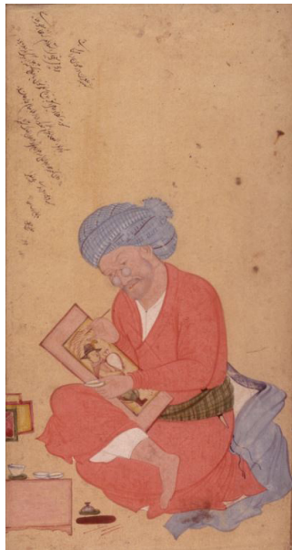
تصویر ۶- رضا عباسی در حال نقاشی، اثر معین مصور. مأخذ: (آزند، ۱۳۸۵، ۱۶۶)

«چهره نقاش» خود می‌تواند موضوعی برای نقاشی شود. به‌ویژه در این نمونه خاص که بزرگداشتی پس از چهل سال انجام شده است. جزئیاتی که در ترسیم حالت چهره رضا عباسی به‌ویژه در حالت چشم‌ها، لب‌ها و ریش و سبیل آمده است، نشان از دقت نقاش در بازنمایی و تلاش در جهت شبیه‌سازی موضوع دارد. از سوی دیگر این نقاشی می‌تواند نشان‌دهنده توجه بیش‌از‌پیش به تشخیص چهره «افراد» باشد. در نقاشی‌های تک‌برگ رضا عباسی و پیروانش همچون معین مصور نمونه‌های فروانی از این چهره‌گشایی‌ها مشاهده می‌شود. در این نقاشی‌ها افراد از اقشار گوناگون به تصویر کشیده می‌شدند و چهره آن‌ها به نسبت واجد حالات درونی آن‌ها بود. این در حالی بود که نقاشان درباری در کتابخانه‌های شاهی اغلب مشغول تصویر کردن روایات کلامی بودند. روایاتی که در آن‌ها «افراد» بیشتر در مقام انبوهی از ملازمان و همراهان تصویر می‌شدند. حتی در مواردی که به نحوی قرار بوده است افراد خاصی در روایت تصویر شوند «چهره» آن افراد فاقد تشخیص فردی و احساس درونی بود. تصویر «انسان» در نگارگری ایرانی نیز - به نسبت - فاقد تفرّد است. «انسان» سنت نگارگری ایرانی چه نقاش باشد و چه موضوع نقاشی بیشتر خصلت «نوعی» دارد. این موضوع در تصویر (۷) مشهود است. این تصویر بزرگنمایی چهره‌های متفاوت موجود در «یک» نگاره در شاهنامه بایسنقری است. تمایز چهره‌ها از یکدیگر به‌سختی امکان‌پذیر است و آناتومی چهره و سر تقریباً میان همه آن‌ها یکسان است. چهره‌ها در این نگاره بیشتر از آنکه مربوط به فردی