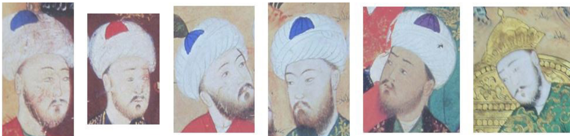
تصویر ۷- چهره‌های مشابه در یک نگاره شاهنامه بایسنقری میانه‌های قرن ۹ هجری.