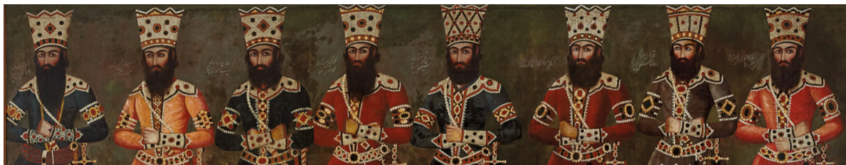
تصویر ۸- بخشی از تابلوی «صف سلام» منسوب به عبدالله خان نقاش‌باشی. دوره قاجار.

این تصویر نگاره‌ای تک‌برگ است با ابعادی کوچک و حاشیه بسیار ساده. همین شمای کلی به سرعت آن را از سنت پر جزئیات و فاخر درباری جدا می‌کند. در این نقاشی زن و مردی با خطوط موج و تند و کند قلم‌مو کشیده شده است. زن قدی کوتاه‌تر دارد و در حالی که در آغوش مرد جای گرفته با چشمانی مشتاق و با لبخندی محو به مرد می‌نگرد، مرد