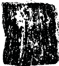
شکل ۲- یک نمونه تصویر دوتایی از یک نمونه گوشت سرخ شده

برای آنالیزهای بعد برخالی در فرک لک با استفاده از روش شمارش جعبه، باید یک الگو ۸ استخراج شده و به یک تصویر دوتایی (سیاه و سفید) تبدیل گردد. دلیل آن این است که فرک لک تنها قادر است پیکسل های سیاه در یک پس زمینه سفید و یا پیکسل های سفید در یک پس زمینه سیاه را تشخیص دهد. البته در فرک لک این امکان وجود دارد که تصاویر آستانه ۹ به صورت خودکار دوتایی شوند. نمونه یک تصویر دوتایی از یک نمونه گوشت سرخ شده در شکل (۲) آورده شده است.