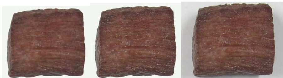
شکل ۱- پیش پردازش تصاویر مربوط به نمونه گوشتی که با پیش تیمار میکروویو W/g ۵/۲۳، در دمای ۱۶۰ درجه سانتی گراد و زمان ۴۵ ثانیه سرخ شده (از چپ به راست ابتدا حذف پس زمینه تصاویر با استفاده از نرم افزار فتوشاپ و سپس استفاده از فیلتر میانه با شعاع یک پیکسل)

همان مقیاسی است که برای یک شیء استفاده می شود. در فرک لک این مقیاس برابر نسبت اندازه جعبه به اندازه تصویر می باشد؛ که منظور از اندازه تصویر، مرز شامل قسمت پیکسلی ۷ یک تصویر است. مقادیر خطای استاندارد در محاسبه بعد برخالی از رابطه (۳) محاسبه می شوند: