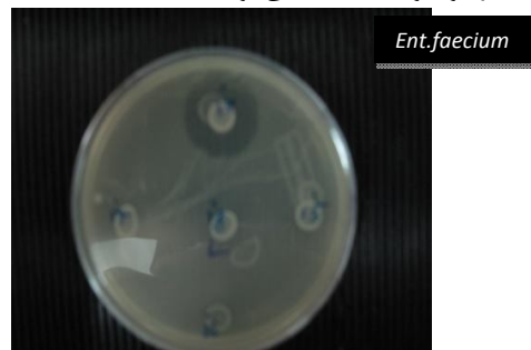
شکل ۱- هاله شفاف حاصل از بازدارندگی سویه Ent. Faecium بر روی باکتری شاخص Listeria innocua .

اما از میان ایزوله‌های اسید لاکتیک، دو ایزوله Ent. Faecium کد B161 و Str. thermophilus کد B258 بیشترین اثر بازدارندگی یا قطر هاله حاصل از بازدارندگی را روی باکتری شاخص Listeria innocua نشان دادند. شکل ۱، هاله شفاف حاصل از بازدارندگی ایزوله Ent. faecium بر روی باکتری Listeria innocua را نشان می‌دهد. نکته جالب و قابل توجه اینکه، هر دو سویه مورد نظر از کره مسکه، ایزوله شده بودند، که نشان‌دهنده این حقیقت است که منشأ اولیه هر دو سویه احتمالاً یکی بوده است.