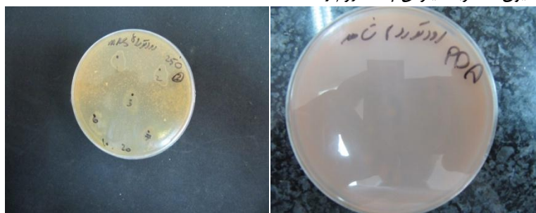
شکل ۱- نمونه شاهد مخمر رودوتورولا موسیلوجینوسا (الف) و جدایه‌هایی که بر آن خاصیت ضد مخمری دارند (ب)

در جدول شماره ۲ نتایج مربوط به روش نفوذ در چاهک بر روی مخمر رودوتورولا موسیلوجینوسا آورده شده است. بیشترین قطر هاله مربوط به ایزوله C28 با قطر ۱۱ میلی‌متر و کمترین قطر هاله مربوط به ایزوله LF52 با قطر ۴ میلی‌متر بود.