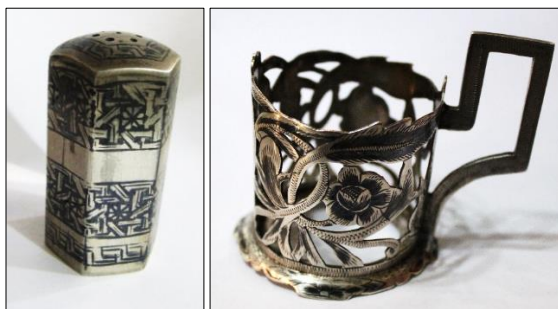
تصویر ۱۸. زیراستکانی نقره‌ای، اثر هنرمندان ارمنی تبریز تصویر ۱۹. نمکدان نقره‌ای، اثر هنرمندان ارمنی تبریز