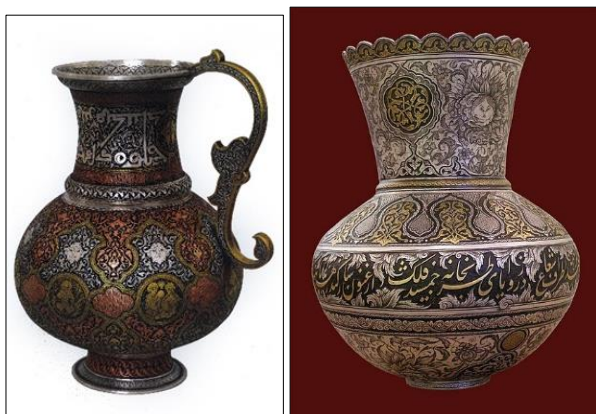
تصویر ۲۰. گلدان نقره، اثر محمدمهدی باباخانی، موزه حسن‌پور اراک،