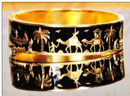
تصویر ۱۷. دستبند طلایی سیاه‌قلم شده، زیورآلات اقوام صابئین مندایی اهواز

زیباتر شدن کار، نقوش با قلم‌های مخصوص حکاکی می‌شود و در نهایت با پرداخت اثر محصول نهایی به دست می‌آید (اصغرزاده، زاهدپور، ۱۳۹۴، ۴-۵) در تصویر (۱۷) به نمونه‌ای از آثار معاصر هنرمندان صبی اشاره شده است.