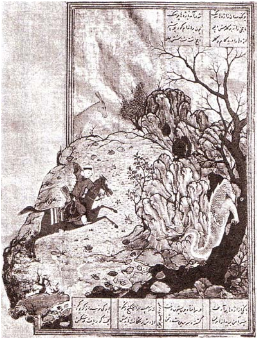
تصویر شماره ۲: برگرفته از گری، ۱۳۶۹ بهرام گور اژدها را می‌کشد

ذکرهای مختلف، هر کدام نور خاص خود را دارند و مثال خورشید، نمایانگر کمال دل است. مشاهده نورهای رنگی هم بسته به رنگ نور، نشان از مقام‌های مختلف عارف دارد. نور کبود، نمایانگر نفس لوامه یا ظلمت نفس است که با نور روح آمیخته گشته و نور سپید، نمایانگر اسلام و حد اعلای معرفت است. بنابراین از دیدگاه ابن عارف الهی هر چه میزان ظلمت نفس بیشتر است نور به سوی رنگ تیره جریان دارد و هر چه میزان معنویت نفس بیشتر شود بر روشنایی نور افزوده می‌گردد تا آن‌جا که اگر تمام دل به غایت صفا برسد دیگر هیچ رنگی باقی نمی‌ماند. همین‌طور نور سبز را برابر با نفس مطمئنه می‌داند که از نور روح و صفای دل برخاسته است. او از نور دیگر به رنگ سیاه تیره نام می‌برد که آن را جلوه صفات جلال الهی برمی‌شمرد (رازی، ۱۳۶۱).