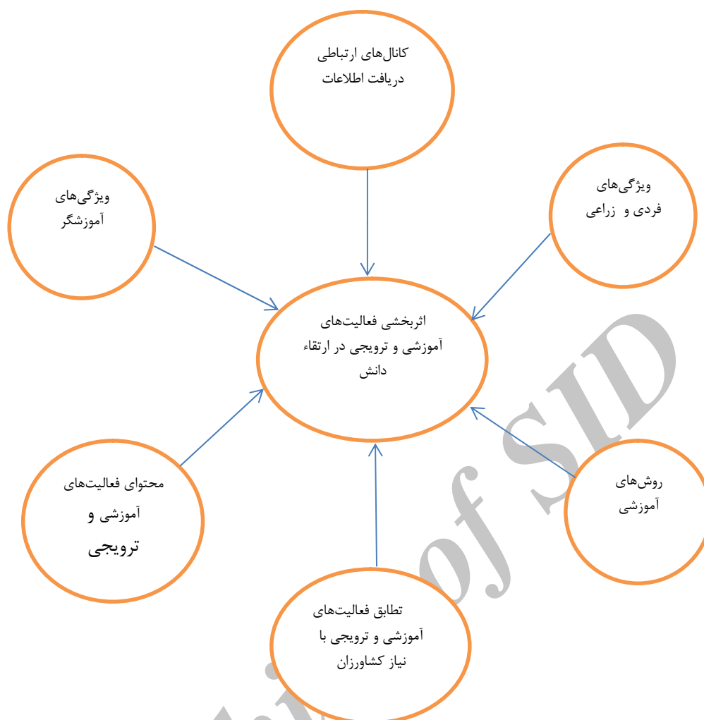
نگاره ۱- چارچوب نظری تحقیق

عنوان نمونه تعیین گردید. با توجه به توزیع توتون کاران در شهرستان‌های استان، نمونه‌گیری به صورت تصادفی و با روش انتساب متناسب صورت گرفت. از تعداد ۳۰۶ پرسش‌نامه توزیع شده، حدود ۸۵ درصد تکمیل و جمع آوری گردید. ابزار اصلی مورد استفاده در این تحقیق پرسش‌نامه بوده است. سوالات با استفاده از مبانی نظری، تحقیقات انجام شده و فرضیات تحقیق، طراحی شد که پس از تعیین روایی و پایایی، اصلاحات لازم بر روی آن صورت پذیرفت و از روش میدانی برای تکمیل آن استفاده گردید. روایی پرسش‌نامه با کسب نظر متخصصان و استادانی از دانشکده کشاورزی دانشگاه منابع طبیعی گرگان و دانشکده کشاورزی دانشگاه آزاد اسلامی واحد ساری مورد تایید قرار گرفت. پایایی پرسش‌نامه توسط آزمون مقدماتی در خارج از نمونه اصلی تعیین شد و