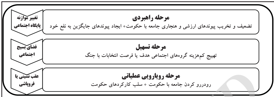
شکل ۱. فرایند کلی تهدید نرم (حسینی، ۱۳۸۹، ص ۴۲)

«رفیع پور» مراحل تحت تأثیر قرار گرفتن افراد جامعه را در برابر تبلیغات (و تهدید نرم) در