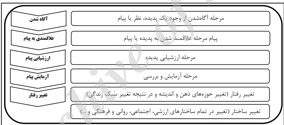
شکل ۲. مراحل تحت تأثیر قرار گرفتن افراد جامعه را در برابر تبلیغات

براساس نظر «ارونسون» و «پراتکانیس» ۱ (۲۰۰۳) افراد روشنفکر زودتر از سایر افراد جامعه در برابر تهدید نرم، (به‌خصوص در حوزه فرهنگی) این مراحل را طی می‌کنند و رفتار خویش را تغییر می‌دهند. می‌توان نتیجه گرفت که عاملان تهدیدات نرم، همه افراد و گروه‌های جامعه آماج را مخاطب قرار می‌دهند. ولی، برای هر یک از گروه‌های مخاطب، از ابزارها و شیوه‌های مختلفی بهره می‌گیرند (عقیلی و مصطفوی، ۱۳۹۲، ص ۳۵). با توجه به موارد بیان‌شده می‌توان هرم مخاطبان در تهدید نرم را به‌صورت شکل ۳ ترسیم کرد: