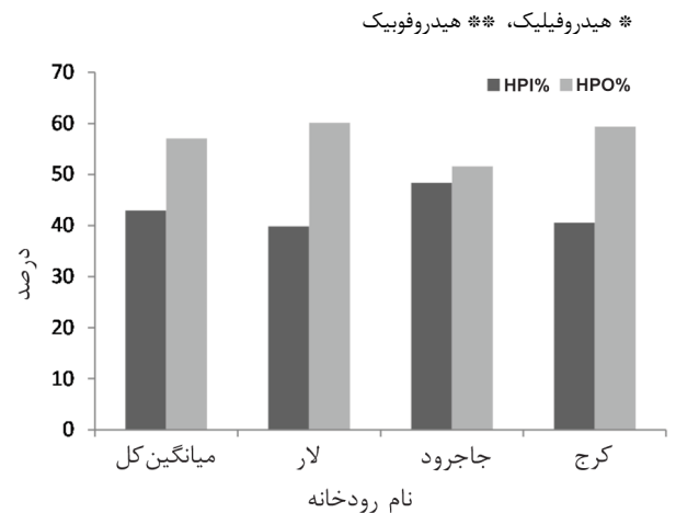
شکل ۳: تغییرات غلظت NOMs در سه ماه نمونه برداری از منابع آب تهران

بخش آب گریز NOMs در طی این مطالعه غالب بوده است. در شکل ۳ تغییرات غلظت NOMs در سه ماه نمونه برداری نشان داده شد و مشخص است که با گرم شدن هوا بر غلظت NOMs به میزان ناچیزی افزوده می شود.