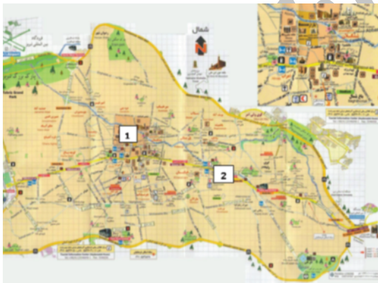
شکل ۱: نقشه شهر تبریز و موقعیت ایستگاه های اندازه گیری صدا

این پژوهش یک مطالعه از نوع توصیفی - مقطعی است. هدف از اندازه گیری آلودگی صدا در نقاط پرتراфик شهر تبریز مشخص نمودن وجود آلودگی صوتی در این شهر است. لذا ۲ نقطه شلوغ، پرتراфик و حساس شهر تبریز از نوع منطقه تجاری و تجاری - مسکونی برای این موضوع انتخاب گردید و روزانه در ۳ نوبت صبح (از ساعت ۷/۳۰ الی ۹/۳۰)، ظهر (از ساعت ۱۲/۳۰ الی ۱۴/۳۰) و شب (از ساعت ۱۹ الی ۲۱) مطابق روش اعلام شده از سوی سازمان EPA و به طور همزمان در دو ایستگاه منتخب انجام گرفته و بر حسب دسی بل در فرم های طراحی شده برای این منظور ثبت گردید. این اندازه گیری ها به مدت یک ماه تداوم یافت، به طوری که در هر یک از روزهای ایام هفته حداقل ۴ مرتبه سنجش در سه بازه زمانی مشخص شده صورت گرفته و در مجموع ۱۸۰ رکورد در طی این یک ماه نمونه برداری به دست آمد. داده های حاصل با استفاده از آمار توصیفی نرم افزار SPSS، مورد تجزیه و تحلیل آماری قرار گرفته و نمودارها در نرم افزار Excel رسم شدند. تراز معادل فشار صوت در ایستگاه ها با استانداردهای مربوط به صدا در هوای آزاد ایران به صورت روزانه (۷ صبح الی ۱۰ شب) مورد مقایسه قرار گرفت.