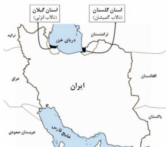
شکل ۱: نمایش منطقه مورد مطالعه

عمدتا ورود جیوه و مشتقات آن به بدن انسان، از طریق مصرف مواد غذایی و آبزیان صورت می گیرد (۱۰). میانگین غلظت جیوه در بافت های مورد مطالعه به صورت جدول زیر می باشد (جدول ۱). نتایج نشان می دهند میزان جیوه در کبد همه گونه ها، به جز چنگر بیشتر از سایر بافت ها است. دلیل اصلی این موضوع به نقش کبد در فرایند متیلاسیون جیوه و درصد چربی بیشتر این بافت نسبت سایر بافت های داخلی در این دو گونه برمی گردد (۷). در چنگر به دلیل این که از یک طرف در سطح غذایی پایین تری قرار گرفته و از طرف دیگر رژیم غذایی این گونه کمتر مواد آلوده به جیوه دارد، همچنین درصد چربی بافت های آن نسبت به دو گونه دیگر کمتر بوده و طول عمر بسیار کمتری دارد، لذا میزان جیوه بیشتر در پرتجمع یافته است. همچنین عضله این گونه کمترین میزان جیوه را نسبت به همه بافت ها در هر سه گونه داشته است.