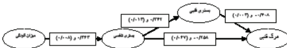
شکل ۲: مدل تحلیل مسیر بر اساس برآورد روابط استاندارد بین متغیرها (داخل پراتنز سطح معنی داری)

آزمون فرضیات با استفاده از روش تحلیل مسیر: بر اساس ضرایب همبستگی معنی دار می‌توان از شکل ۱، شکل ۲ را استخراج و معرفی نمود.