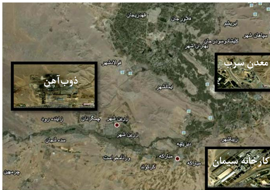
شکل ۱: اراضی منطقه مورد مطالعه

در بالن ژوژه ۵۰ mL جمع آوری و توسط دستگاه دستگاه جذب اتمی مدل پرکین المر (Atomic Absorption – Perkin Elmer 3030 غلظت فلزات سنگین کادمیوم و سرب تعیین گردید (۱۷). توصیف آماری داده‌ها با استفاده از نرم‌افزار Statistica نسخه ۶ صورت گرفت. همچنین مقایسه میانگین‌ها با آزمون LSD انجام شد.