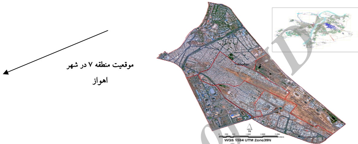
شکل ۱: موقعیت جغرافیایی منطقه حصیرآباد در شهر اهواز

به این منظور، از دستگاه اندازه‌گیری ۳D EMF TESTER مدل EMF - ۸۲۸ و روش اندازه‌گیری موجود در استاندارد (National Institute of Environmental Health Sciences) NIEHS (استفاده شد (۱۳). اندازه‌گیری شدت میدان مغناطیس در چهار فاصله ۱۵، ۳۱، ۶۱ و ۹۱ m از