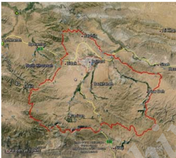
شکل ۱- حوضه آبخیز شهری بجنورد

ابنیه اصلی و مهم شهر همچون مجتمع‌های دانشگاهی و بیمارستان‌ها در بخش جنوبی شهر، عمارت مفخم و آبنه‌خانه در مرکز شهر، استادیوم ورزشی و فرودگاه بجنورد در شمال غرب محدوده شهر و همچنین شهرک‌های صنعتی در غرب شهر واقع شده‌اند. بیشترین میزان ترافیک در خیابان‌های طالقانی و امام خمینی و بلوار نیروگاه است که در جهت شرقی غربی گسترش یافته‌اند و از مرکز ثقل شهر عبور می‌کنند (۷).