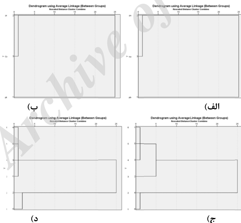
نمودار ۲- دندروگرام آنالیز خوشه‌ای غلظت فلزات در نمونه‌های باران فصل پاییز (الف) و فصل بهار (ب) و آنالیز خوشه‌ای ایستگاه‌های اندازه‌گیری مربوط به غلظت فلزات نمونه‌های باران فصل پاییز (ج) و فصل بهار (د)

می‌دهد که در فصل پاییز ۹۴، عناصر روی و مس دارای رابطه مثبتی هستند (نمودار ۲-الف). همچنین در فصل بهار ۹۵ نیز، عناصر روی و مس دارای رابطه مثبتی هستند (نمودار ۲-ب). لازم به ذکر است نتایج تحلیل خوشه‌ای با نتایج ضریب همبستگی پیرسون (Pearson) مطابقت دارد و نشان می‌دهد که عناصر دارای رابطه نزدیکتر، دارای عوامل کنترلی یکسانی هستند و منابع محتمل آلودگی مشترکی دارند. این در حالی است که در مطالعات Kamani و همکاران (۲) به‌منظور بررسی منابع محتمل آلودگی فلزات سنگین با استفاده از روش تحلیل عاملی (FA) به این نتیجه رسیدند که فلزات سرب، روی و مس در یک مولفه قرار گرفته و منشأ آلودگی انسانی و غیر طبیعی دارند. همچنین آنالیز خوشه‌ای سلسله‌مراتبی انجام شده برای ایستگاه‌های اندازه‌گیری مورد اشاره در جدول ۱، حاکی از آن