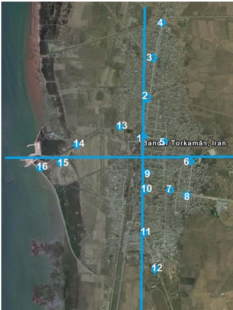
شکل ۲- ایستگاه‌های اندازه‌گیری آهنگ دز گامای محیطی در فضای باز در شهر بندر ترکمن

به دست آمده پس از طبقه بندی، توسط نرم افزار Excel و با آزمون آماری T (T-test) مورد تجزیه و تحلیل قرار گرفت. استان گلستان در شمال ایران واقع شده است و طول و عرض جغرافیایی شهرهای گرگان به ترتیب 54/16 و 36/58 درجه و بندر ترکمن 54/04 و 36/54 درجه است. شهر گرگان با وسعتی بیشتر از 60 \text{ km}^2 طبق آخرین سرشماری سراسری که در سال