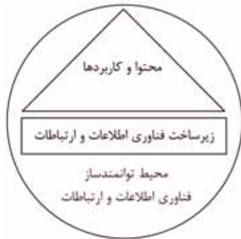
شکل ۲- هسته مرکزی مدل کلان چارچوب توسعه پارک‌های مجازی در ایران

سایبرنتیکی ۱۱ (قانون مربوط به فضاهای مجازی)، مقررات و خط مشی‌ها، توسعه مناطق دورافتاده و حاشیه نشینان، عدالت دیجیتال و جلوگیری از تبعیض دیجیتال، سرمایه‌گذاری و تجارت، برنامه‌ریزی و اداره امور فناوری اطلاعات و ارتباطات، توسعه منابع انسانی، ایجاد ظرفیت و جامعه الکترونیکی. در این زمینه «پورتال ملی ایران» ۱۲ - که به تازگی راه‌اندازی شده - نیز به مرور که توسعه یافته و تقویت می‌شود، می‌تواند گزینه خوبی برای بهره‌برداری باشد.