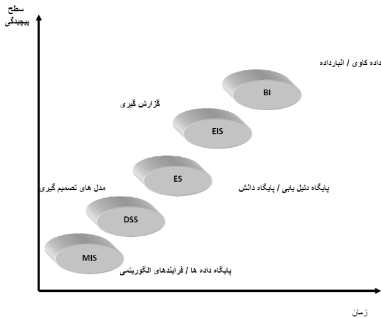
شکل ۱- توسعه سیستم‌های اطلاعاتی مدیریت [۷]

معروض بلوغ رسیده است و قادر هستند که سیستم‌های مدیریت محتوایی را با هم ترکیب کنند و قابلیت متن کاوی ۱ که ارزش بیشتری از اطلاعات متن به ارمغان می‌آورد را فراهم کند. بنابراین این سیستم‌ها قابلیت را برای شرکت‌ها به ارمغان می‌آورند که به طور همزمان متن و اطلاعات خام را بتوانند با هم ادغام کنند.