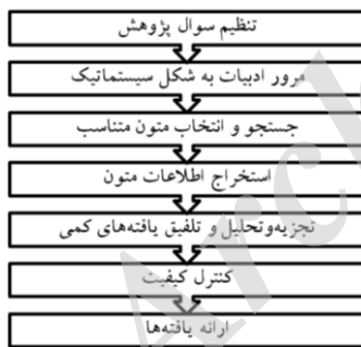
شکل ۱- گام‌های فراتلفیق

از آنجایی که مدل‌های ارزیابی آمادگی الکترونیک عموماً با رویکرد کیفی ارائه شده است، لذا روش فراتلفیق روش مناسبی برای به‌دست آوردن تلفیق جامعی از مدل‌های آمادگی الکترونیک بر پایه ترجمه مطالعات کیفی وسیع است. نوبلت و هیر (۱۹۹۸) سه فاز اصلی، انتخاب مطالعات، ترکیب ترجمه‌ها و ارائه تلفیق را برای روش فراتلفیق ارائه نموده است. در این پژوهش از روش گام‌های هفتگانه باروس و ساندلوسکی (۲۰۰۷) در فراتلفیق که خلاصه آن در نمودار زیر آمده، استفاده شده است.