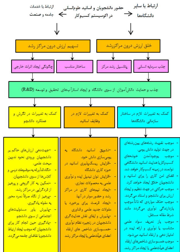
شکل ۳- دانشگاه‌های نسل سوم علوم انسانی

در واقع دانشکده‌های علوم انسانی عضو از ارگان‌های به حساب می‌آیند که خود قسمتی از اکوسیستم بزرگ‌تر محسوب می‌شود بنابراین اگر اکوسیستم آموزش شامل تمام اعضای ارگان‌های باشد در اینصورت نیازمند تعامل و تعادل دانشگاه علوم انسانی با اکوسیستمی است که در آن قرار دارد. مشارکت دانشگاه‌های مکمل دانشکده‌های علوم انسانی مانند دانشگاه فرهنگیان، فنی حرفه‌ای و کاربردی با نهادهای دیگر مستلزم تبیین اکوسیستم آموزشی دانشگاه با نهادهای حاکمیتی، حکومتی می‌باشد. عملکرد مناسب یک اکوسیستم وابسته به ایجاد مرکزی است که بتواند فضایی را فراهم سازد تا تمامی اعضای آن مجموعه در راستای هدف مشترک به بازدهی هدف‌گذاری شده برای خود نایل شوند و در این راستا از همکاری سایر اعضا بهره‌مند گردند. ایجاد چنین ساختاری در اکوسیستم آموزشی بمنظور تولید دانش بومی اسلامی- ایرانی مراکز رشد علوم انسانی است که می‌تواند با نظارت دانشگاه علوم انسانی ایجاد گردد. شکل زیر تبیین‌کننده این ساختار برای مشارکت دانشگاه علوم انسانی با سایر نهادهای مربوطه می‌باشد که هسته اصلی آنرا اساتید دانشگاه‌ها، معلمان مدارس، دانشجویان و دانش‌آموزان شکل می‌دهد: