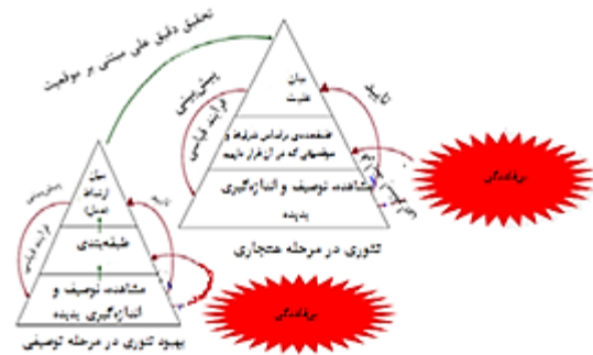
شکل ۲- حرکت از نظریه توصیفی به نظریه هنجاری

بهبود تئوری به مانند سه مرحله انجام شده در مرحله توصیفی، پژوهش خود را ادامه می‌دهند. با این فرض ۱ که بیان آنها از علیت صحیح است، از پایین هرم (مرحله اول، مشاهده) برای آزمودن بیان علیت خود حرکت می‌کنند (استدلال قیاسی ۲ ). هنگامی که با بی‌قاعدگی مواجهه شوند، در مرحله طبقه‌بندی (مرحله دوم) بررسی خود را ادامه می‌دهند (استدلال استقرایی ۳ ). در این مرحله پدیده‌ها را براساس ویژگی‌ها طبقه‌بندی نمی‌کنند بلکه آنها را براساس شرایط و موقعیت‌های متفاوت که در آن قرار دارند طبقه‌بندی می‌کنند. آنها هنگام مواجهه شدن با بی‌قاعدگی از خود می‌پرسند: چه عاملی باعث این تفاوت شده است؟ این پژوهشگران که بدنبال بدست آوردن علت این بی‌قاعدگی هستند با طرح این پرسش و حرکت از بالا به پایین هرم در گام دوم (نظریه هنجاری)، در نهایت مجموعه کاملی از شرایط و موقعیت‌هایی را که ممکن است هنگام جستجوی نتایج دلخواه با آن مواجهه شوند را بررسی می‌کنند. این حرکت برای محققان این امکان را فراهم می‌سازد که به بیان رابطه علی ۴ پدیده مورد نظر بپردازند (شکل ۲).