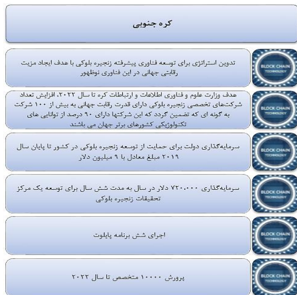
شکل ۲- بخش‌های اصلی از اجزای اجرایی برنامه کره در زمینه زنجیره بلوکی

شکل ۲ بخش‌های اصلی از اجزای اجرایی برنامه فوق را بصورت کلی نشان می‌دهد.