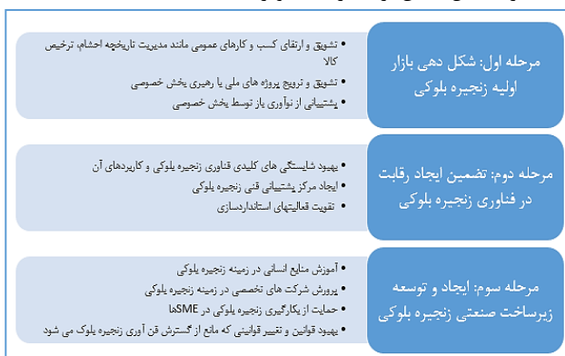
شکل ۱- برنامه کره جنوبی در زمینه زنجیره بلوکی در یک نگاه

برنامه توسعه فناوری زنجیره بلوکی از سه مرحله تشکیل شده است: تشکیل بازار اولیه زنجیره بلوکی، ایجاد مزیت رقابتی و تضمین رقابت در فناوری زنجیره بلوکی و تضمین حرکت در مرز دانش این فناوری، و ایجاد زیرساخت صنعتی زنجیره بلوکی [۱۸]. شایان ذکر است که این سه مرحله بصورت همزمان از ابتدای سال ۲۰۱۸ شروع شده و تا انتهای سال ۲۰۲۲ ادامه دارد. شکل ۱ این برنامه را به تصویر کشیده است.