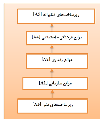
شکل ۱- مدل ISM تحقیق برای متغیرهای اصلی پژوهش

حال، پس از تعیین روابط و سطوح متغیرها، در یک جمع بندی نهایی می‌توان آن‌ها را به شکل مدلی ترسیم نمود. شکل [۱] به عنوان مدل نهایی پژوهش بوده و نمایانگر مدل روابط در جامعه تحت مطالعه با نگرش ساختاری-مقایسه‌ای هست.