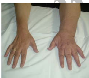
بعد از درمان