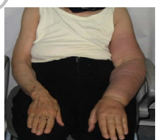
قبل از درمان