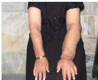
بعد از درمان