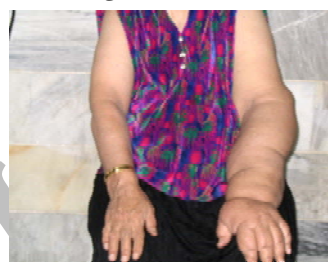
قبل از درمان